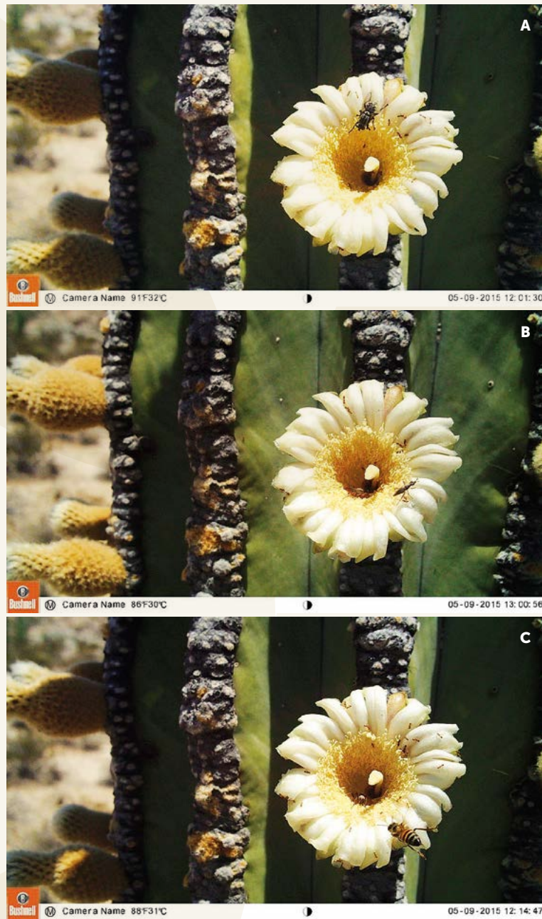
Figura 2. Con la técnica se pueden registrar los insectos polinizadores como A y B) moscas y C) abejas, y la actividad de las hormigas.