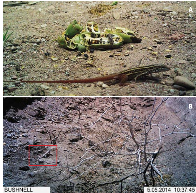
Figura 1. Comparación de registros de reptiles entre la cámara trampa A) Bushnell NatureView CAM HD con lente de enfoque de 25 cm, donde es posible identificar la especie y B) Bushnell Trophy CAM donde se registra el reptil pero no es posible identificar la especie.

una técnica nueva de fototrampeo para contabilizar e identificar insectos y reptiles, que con las técnicas y equipo convencionales de fototrampeo (Rowcliffe y Carbone, 2008) no suelen ser registrados por la limitada capacidad que tienen los lentes para enfocar animales pequeños y cercanos o detectar sus sutiles movimientos (Figura 1). La técnica permite registrar a los polinizadores diurnos y nocturnos de especies de interés, a los insectos con potencial de plaga, registrar la actividad de reptiles y su capacidad de dispersión de semillas, entre otros. Para lograr imágenes nítidas que permitan la identificación de los organismos es necesario tener cámaras trampa digitales de observación de vida silvestre que cuenten con un sistema de iluminación infrarroja, sensor de detección de movimiento y lentes de enfoque