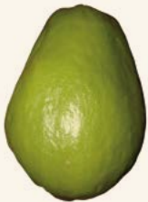
Figura 5. Frutos sanos de chayote con calidad exportación.