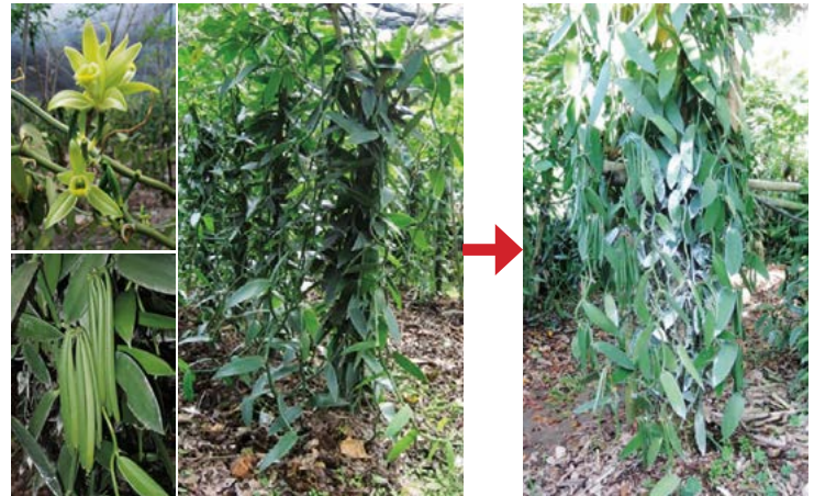
Figura 3. Caracteres que determinan mayor rendimiento en plantas de vainilla.