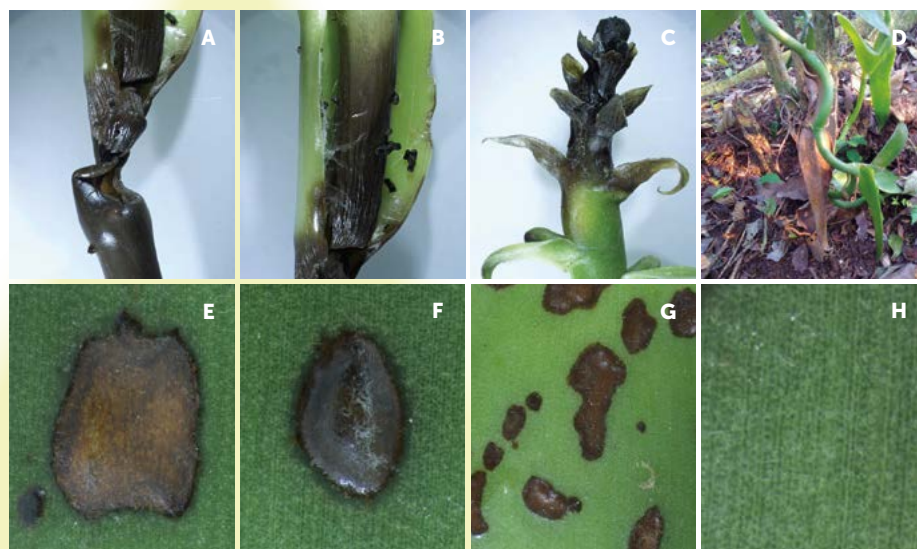
Figura 1. Oscurecimiento del tallo (A-C) y manchas café de forma irregular en hojas (E-G) de vainilla en Cazones de Herrera, Veracruz, México. Tallo (D) y Hoja (H) asintomáticos.

La vainilla está en interacción con diferentes microorganismos. Cuando las prácticas de manejo agronómico,