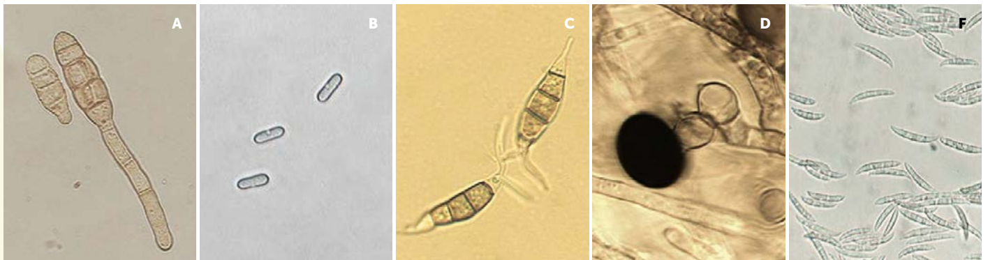
Figura 2. Alternaria sp. (A), Colletotrichum sp. (B), Pestalotia sp. (C), Nigrospora sp. (D) y Fusarium sp. (E) aislados de tallos y hojas de Vanilla planifolia con lesiones de color oscuro.