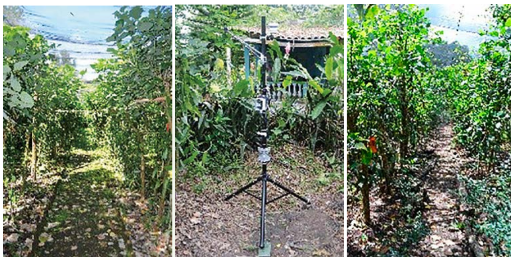
Figura 1. Sistemas de casas sombra para producción de Vanilla planifolia en Papantla y San Rafael, Veracruz, México.

cuanto a luminosidad y humedad del suelo. Cada casa sombra tuvo un comportamiento diferente, aún aquellas de la misma región, mientras que la humedad del suelo tuvo menos variación, aumentando notablemente en algunos meses, asociado a posibles eventos de riego por los propietarios. El porcentaje de frutos retenidos hasta la cosecha fue del 68% y 51% en los años 2014 y 2015 respectivamente, con variaciones en tamaño y peso. Históricamente, en el año 2013, se registró que los cultivos de vainilla evaluados en San Rafael fueron más con-