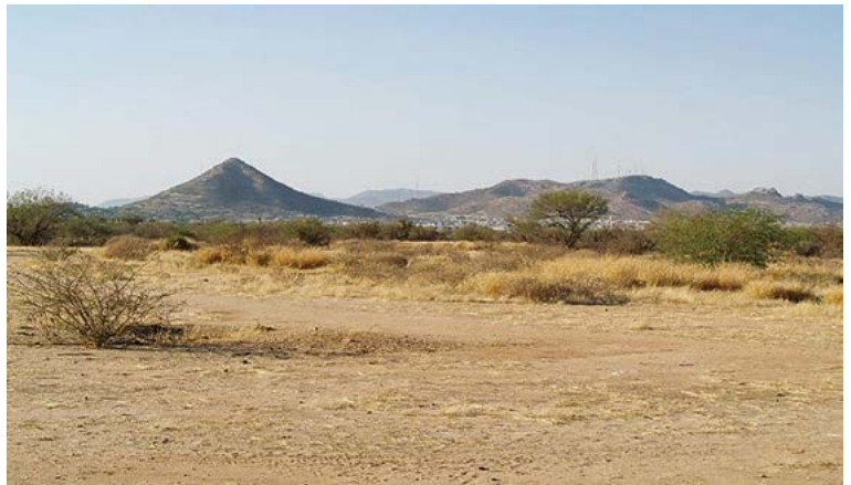
Figura 3. Fraccionamiento Mallorca, zona sur de la ciudad de Hermosillo, Sonora, México.

incrementando el tamaño de muestra de las UM y usando criterios específicos sobre la preferencia del hábitat de la especie, ya que usualmente el mayor número de tecolotes se concentra en áreas relativamente restringidas, por tanto, estas áreas serían foco de conservación absoluta. Acciones relevantes para salvaguardar la población de A. cunicularia en Hermosillo incluyen el mantenimiento cerca de los nidos madrigueras y minimizar la destrucción de éstas mediante un programa de concientización dirigido a los poseedores de las tierras.