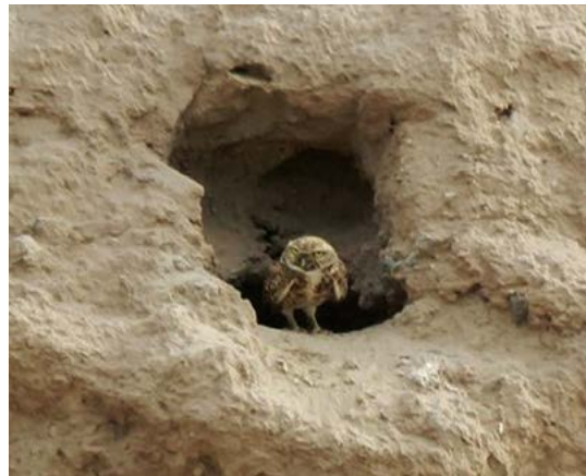
Figura 1. Madriguera de tecolote llanero ( A. cunicularia ), localizada a en la zona periurbana de Hermosillo, Sonora, México.

y conservación por parte de los gobiernos municipales que rara vez es considerado de manera explícita. Debido a la falta de estudios descriptivos sobre la población de A. cunicularia en entornos urbanos de la ciudad de Hermosillo, surge la necesidad de llevar a cabo estudios en esta especie, ya que se desconocen muchos aspectos básicos, incluyendo su densidad poblacional en áreas urbanas. Esta información básica permitirá en cierta medida recomendar una legislación eficaz para su conservación y planificación de la urbanización (Andelman, 1994). El objetivo del presente trabajo fue estimar la densidad poblacional de A. cunicularia durante dos temporadas reproductivas en la zona urbana de la ciudad de Hermosillo, Sonora, México.