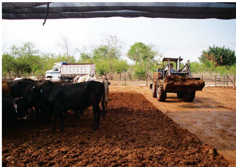
Figura 3. Gallinaza como subproducto de la industria avícola.

quidos (sólidos suspendidos, materia orgánica disuelta, pesticidas, insectos, lechada soluble, jugos, hojas, tallos, etcétera) y sólidos (restos de fruta y hortalizas, frutas en mal estado, semillas, etcétera) con alta carga de material orgánico, pueden ser transformados en compost, o bien, a través de la digestión anaerobia