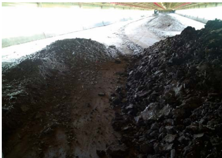
Figura 2. Recolección de estiércol en corrales de bovino de engorda.

en biogás (mezcla de dióxido de carbono y metano) con alto poder calórico. La transformación en estos productos es de gran importancia, dado su