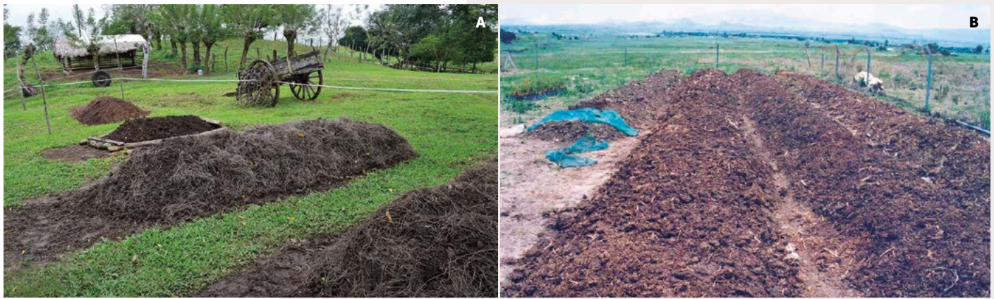
Figura 4. A: Elaboración de composta a base de pasto estrella con estiércol equino y bovino. B: Elaboración de composta con residuos agrícolas y estiércol de bovino, para la producción de hortalizas.