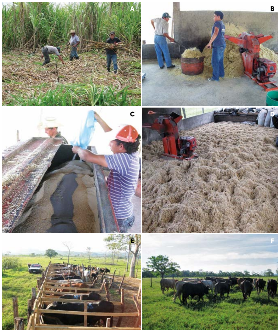
Figura 1. A-B: Corte y picado de tallos de caña de azúcar ( Saccharum spp.). C-D: Mezclado de ingredientes y fermentado. E-F: Grupo de bovinos en evaluación y en pastoreo después de tratamientos.

El suplemento se ofreció diariamente (8:00 am) a razón de 7 g kg -1 de peso vivo base seca en corraletas individuales, las cuales se construyeron en un punto central a todos los potreros para facilitar el manejo de los animales