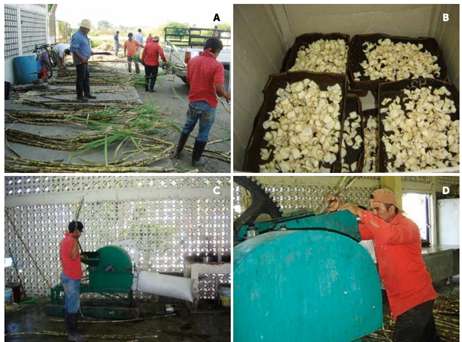
Figura 1. A: Ordenamiento de las muestras. B: Rodajas de tallo para determinar humedad en la sección 8-10. C: Picado de tallos para determinar fibra. D: Extracción de jugo del tallo.

Para generar los tratamientos se utilizó un diseño factorial 17x2 (17 semanas de muestreo [11/11/2011 a 02/03/2012] y dos variedades de caña [CP-72-2086 y Q-997]). Para el muestreo en cada parcela se tomaron nueve tallos más un hijuelo (10 repeticiones) (Figura 1). Las 340 muestras resultantes fueron procesadas en el laboratorio de Campo del Ingenio Huixtla con el método del molino de ensaye (Golcher, 1994). El Anova y la prueba de comparación múltiple de Tukey se