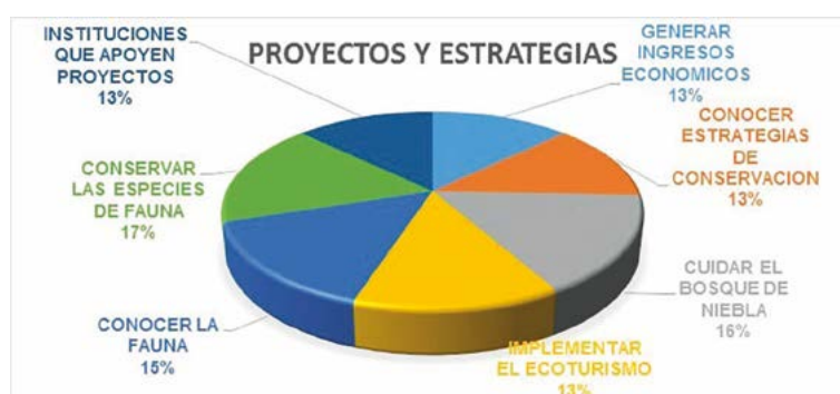
Figura 2. Proyectos y estrategias considerados de mayor importancia para los habitantes de la Esperanza, Oaxaca.

AL CONSEJO DE CIENCIA Y TECNOLOGIA DEL ESTADO DE OAXACA, MEDIANTE EL PROYECTO: Estudio ecológico-genético de Oreomunnea mexicana (Standl.) J.F. Leroy, en bosques mesófilo de montaña de la Sierra Juárez, estado de Oaxaca, FONDO MIXTO 195425-Universidad de la Sierra Juárez. Al Consejo Nacional de Ciencia y Tecnología (CONACYT: CVU 635918) por la beca de postgrado otorgada al primer autor y a los pobladores de la localidad de la Esperanza, Santiago Comaltepec, Oaxaca, por su apoyo incondicional en la realización de este estudio.