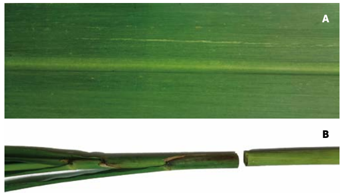
Figura 1. A: Raya fina blanca en la hoja, daño por escaldadura ( Xanthomonas albilineans (Ashby) Dowson). B: Decapitado del tallo en la tercera lígula visible.

Dónde: P.I. = Porcentaje de incidencia de la enfermedad (%); \sum TA = Tallos enfermos; \sum TT = Total de tallos (tallos enfermos+tallos sanos).