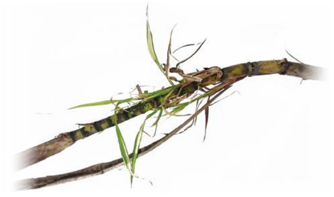
Figura 3. Tallo dañado por Xanthomonas albilineans (Ashby) Dowson de la variedad de caña de azúcar ( Saccharum spp.) SP 72-4928.