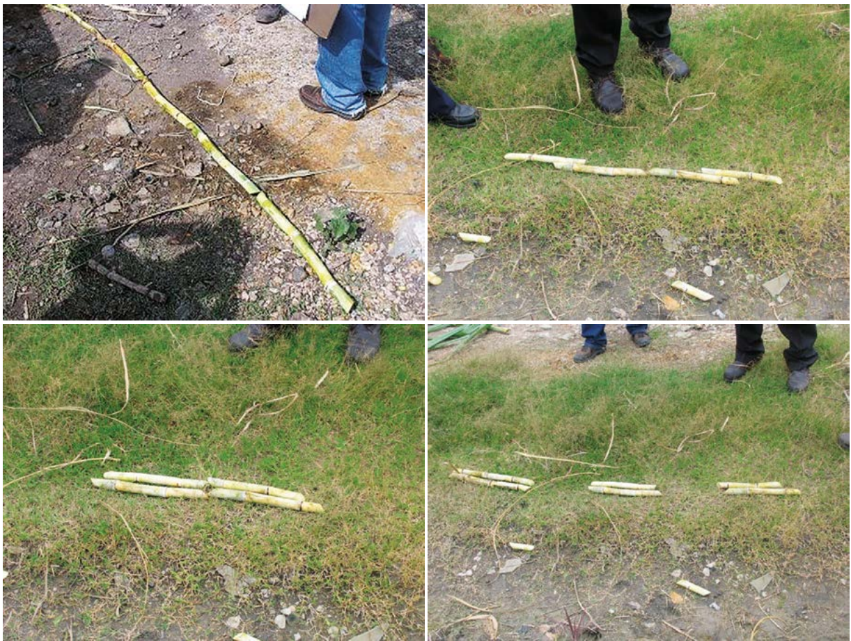
Figura 3. Diversas formas de arreglo de la semilla de caña de azúcar para su siembra.

agregar algún agroquímico, tapar y consolidar el suelo alrededor de la semilla. Debe evitarse el “tapado” mecánico mediante la improvisación de equipo agrícola, ya que no ha dado resultados satisfactorios, pero si incrementado los costos.