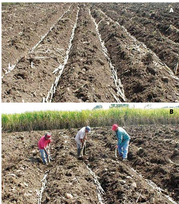
Figura 2. A-B: Colocación de semilla de caña de azúcar en surcos y operación de su tapado. C: Esquema de máquina picadora-sembradora de trozos de caña de azúcar.