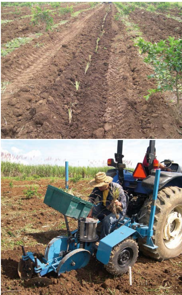
Figura 4. Evaluación de funcionamiento de un prototipo de trasplantadora en donde destaca la uniformidad de la siembra.

La competitividad y rentabilidad del cultivo de caña de azúcar se ven afectadas por diversos factores de la producción y atraso tecnológico (Nova Vargas, 2009; Ripoli y Ripoli, 2010; Taghinezhad et al. , 2014). El manejo del suelo tiene dos objetivos fundamentales; facilitar el desarrollo del cultivo para obtener ganancias y mantener o mejorar la fertilidad del suelo a largo plazo. Por lo que, una manipulación adecuada del suelo debe proporcionar un medio apropiado en el que las semillas puedan germinar y las raíces puedan crecer y, éste debe suministrar los nutrientes necesarios para el desarrollo del cultivo. Tres aspectos destacan respecto a las necesidades de una buena preparación del suelo para la siembra de caña de azúcar; desconocimiento de la calidad del suelo requerido por la semilla y plántula de caña, desconocimiento de las técnicas de manipulación mecánicas racionales y sustentables para la preparación de una cama de siembra para la semilla y plántula de caña y carencia de equipo mecánico de labranza con herramientas simples o en combinación, para