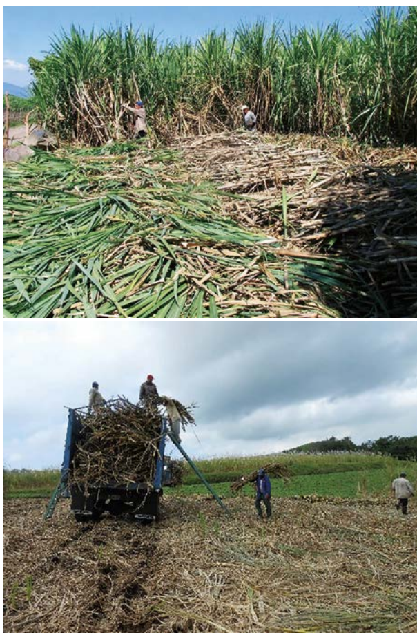
Figura 1. Corte y carga manual de semilla de caña de azúcar ( Saccharum spp.).