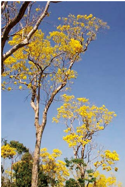
Figura 2. Flores de primavera (arriba), este árbol se distingue en los primeros meses del año por su abundante floración de color amarillo (abajo).