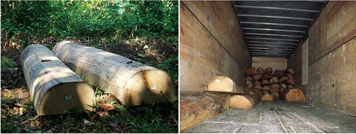
Figura 6. Madera de primavera ( R. donell-smithii ) preparada para embarque para "flitch" (izquierda), y en cajas secas para su traslado a la República de Guatemala (derecha).