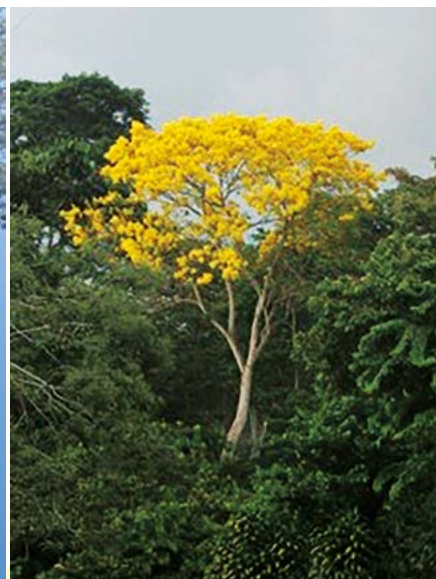
Figura 5. La primavera ( R. donell-smithii ) es una especie común de la Costa de Chiapas, y es ampliamente aprovechada para producción de muebles.