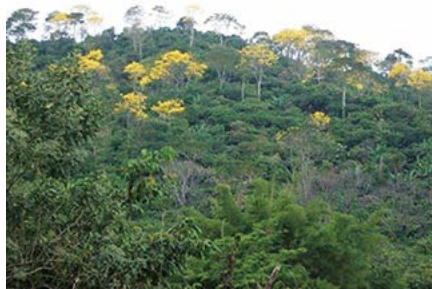
Figura 3. La primavera se produce principalmente en sistemas agroforestales, su función es proporcionar sombra, luego de algunos años su madera es aprovechada.