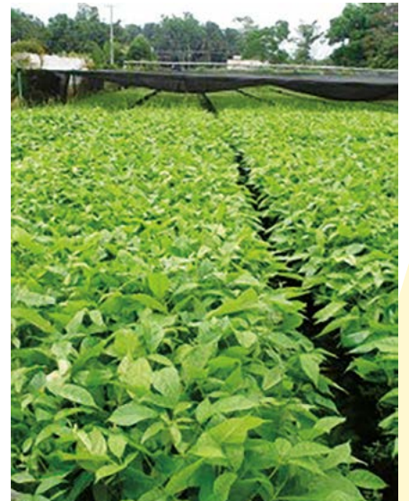
Figura 4. La producción de plantas forestales se hace con diferentes paquetes tecnológicos, en todos se recurre al uso de semillas colectadas regionalmente, un kilogramo de semilla de primavera tiene entre 220,000 y 250,000 semillas.