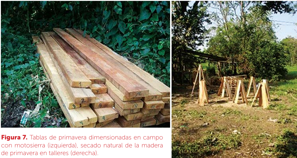
Figura 7. Tablas de primavera dimensionadas en campo con motosierra (izquierda), secado natural de la madera de primavera en talleres (derecha).