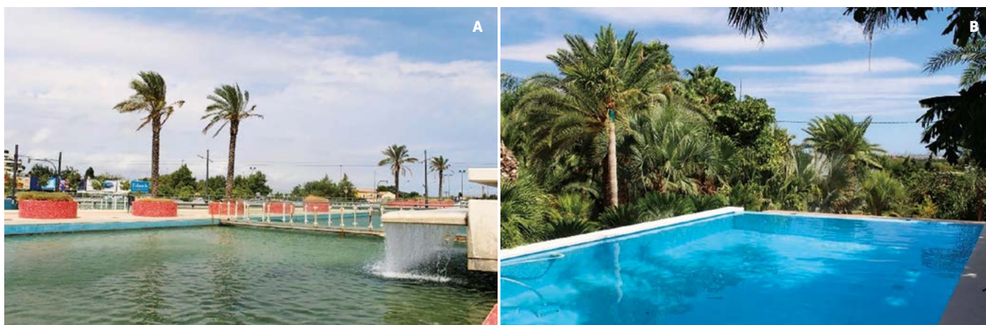
Figura 2. Palmeras datileras ( Phoenix dactylifera L.) A: sin adecuado suministro de agua. B: Con irrigación adecuada.