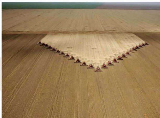
Figura 1. Imagen de 25 cosechadoras en labores de forma automá- tica.

A estas alturas no cabe duda de que el cambio climá- tico va en serio y cada vez resulta más difícil que las medidas paliativas propuesta por algunos líderes y or- ganizaciones mundiales lleguen a cambiar la tendencia o disminuir los efectos. Un cambio climático implica