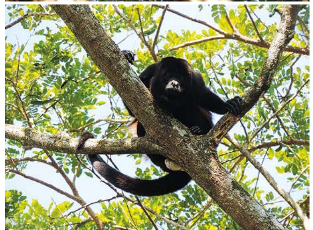
Figura 1. Monos saraguatos ( Alouatta palliata ) en el agrosistema cacao.