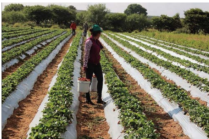
Figura 2. Producción de fresa por surco ( Fragaria fragaria x nanassa (Weston) Duchesne) en La Cócana, Ejido Diego Martín, Salinas, S.L.P.

fertilización con nitrógeno (N) 335 \text{ mg kg}^{-1} , fósforo (P) 121 \text{ mg kg}^{-1} , potasio (K) 389 \text{ mg kg}^{-1} , calcio (Ca) 182 \text{ mg kg}^{-1} , magnesio (Mg) 31 \text{ mg kg}^{-1} , hierro (Fe) 1.44 \text{ mg kg}^{-1} , manganeso (Mn) 0.90 \text{ mg kg}^{-1} , cobre (Cu) 0.12 \text{ mg kg}^{-1} , zinc (Zn) 0.10 \text{ mg kg}^{-1} y boro (B) 3.91 \text{ mg kg}^{-1} . Con estos se prepararon dos soluciones madre en tanques de 1000 L; en el tanque A se disolvió el nitrato de calcio y nitrato de potasio; en el B se disolvió el fosfato mono potásico, el sulfato de magnesio y los micro-elementos. Las soluciones madre se aplicaron al 75% en el agua de riego mediante un sistema de inyección Venturi. En cada riego se agregó ácido nítrico para llevar el pH de la solución del suelo a 6.5. Además, semanalmente se aplicó fertilizante foliar, y en época de lluvia se aplicó fungicida preventivo Cupravit (Oxicloruro de cobre 85%); en una sola ocasión un curativo Cercobin M (Tiofanato metílico: Dimetil-4,4-O-Fenilenbis (3-tioalofanato al 70%).