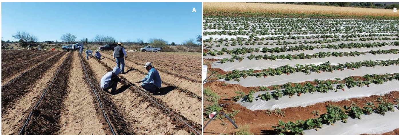
Figura 1. A: Bordes donde se estableció la planta de fresa ( Fragaria fragaria x nanassa (Weston) Duchesne). B: Acolchado del cultivo de fresa con plásticos blanco/negro y plata/negro, ambos en La Cócana, Ejido Diego Martín, Salinas, San Luis Potosí, México.

fertilización con nitrógeno (N) 335 \text{ mg kg}^{-1} , fósforo (P) 121 \text{ mg kg}^{-1} , potasio (K) 389 \text{ mg kg}^{-1} , calcio (Ca) 182 \text{ mg kg}^{-1} , magnesio (Mg) 31 \text{ mg kg}^{-1} , hierro (Fe) 1.44 \text{ mg kg}^{-1} , manganeso (Mn) 0.90 \text{ mg kg}^{-1} , cobre (Cu) 0.12 \text{ mg kg}^{-1} , zinc (Zn) 0.10 \text{ mg kg}^{-1} y boro (B) 3.91 \text{ mg kg}^{-1} . Con estos se prepararon dos soluciones madre en tanques de 1000 L; en el tanque A se disolvió el nitrato de calcio y nitrato de potasio; en el B se disolvió el fosfato mono potásico, el sulfato de magnesio y los micro-elementos. Las soluciones madre se aplicaron al 75% en el agua de riego mediante un sistema de inyección Venturi. En cada riego se agregó ácido nítrico para llevar el pH de la solución del suelo a 6.5. Además, semanalmente se aplicó fertilizante foliar, y en época de lluvia se aplicó fungicida preventivo Cupravit (Oxicloruro de cobre 85%); en una sola ocasión un curativo Cercobin M (Tiofanato metílico: Dimetil-4,4-O-Fenilenbis (3-tioalofanato al 70%).