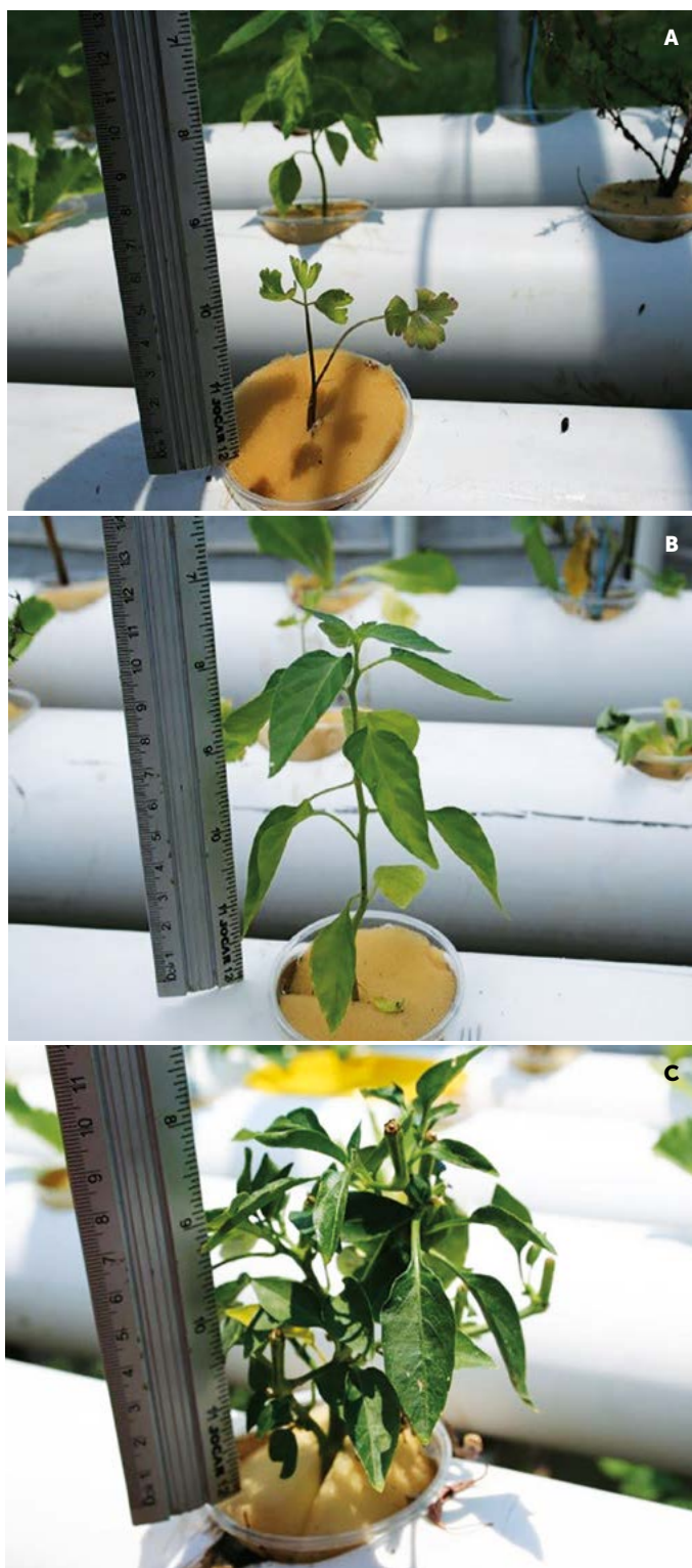
Figura 2. Crecimiento de A: Perejil, B: Chile serrano y C: Chile de ornato en hidroponía.

etapa inicial y de engorda con una dieta comercial con 45% y 35% de proteína cruda, respectivamente. Cada 10 días se evaluó la ganancia de peso en una muestra de 60 peces para estimar el número total de organismos, peso promedio (g), densidad ( \text{kg m}^{-3} ), sobre-