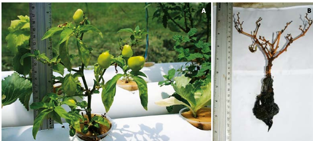
Figura 4. Crecimiento del chile de ornato en acuaponía (A) y siembra tradicional (ST)

tales como, sodio y cloruro. Asimismo es recomendable planificar los eventos que permitan contar con producción constante. En la acuaponía no es necesario la rotación de cultivos, y se puede diversificar tanto en vegetales como en animales, por ejemplo tilapia y camarón. La producción de tilapia en acuaponía permitió una ganancia de peso promedio de 206.01 kg del día 1 al 120, con una tasa de creci-