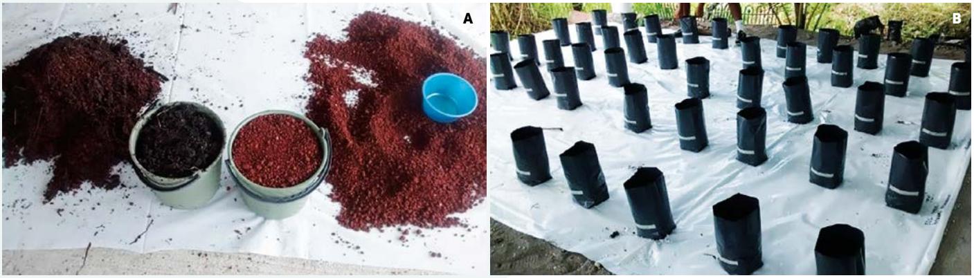
Figura 3. A: Sustratos utilizados. B: Preparación de bolsas con los sustratos para la realización del trasplante.

Cada unidad experimental se regó con 250 mL diarios del agua de riego correspondiente, según se indica en el Cuadro 1. Después de 85 días a partir del trasplante, se evaluaron en las plantas las variables de crecimiento siguientes: altura de planta, diámetro de tallo y peso de la materia seca de plantas.