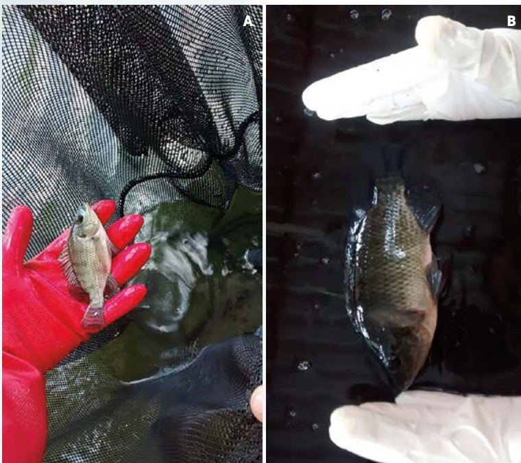
Figura 4. A: Aspecto de las tilapias var. Spring de 30 días, y B: de 85 días de edad.

En lo que respecta a diámetro de tallo, el efecto positivo del riego con agua acuícola se observó en mayor magnitud con el uso de composta y tezontle, que con la composta sola, atribuido a menor oferta de nutrimentos (Figura 6). La misma tendencia fue registrada en el peso de biomasa seca; donde con ambos sustratos se