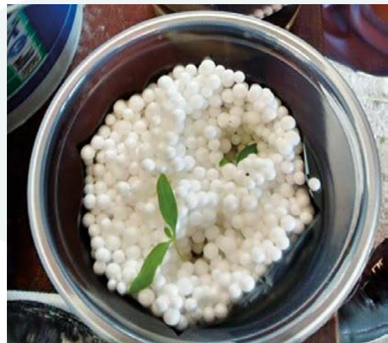
Figura 2. Plántulas de tomate cv. Saladette de 14 días de emergidas, previo al trasplante.

Se trasplantaron dos plántulas por unidad experimental (repetición) (Figura 3). La unidad experimental consistió en una bolsa de 3 kg de capacidad conteniendo alguno de los tres sustratos descritos en el Cuadro 1.