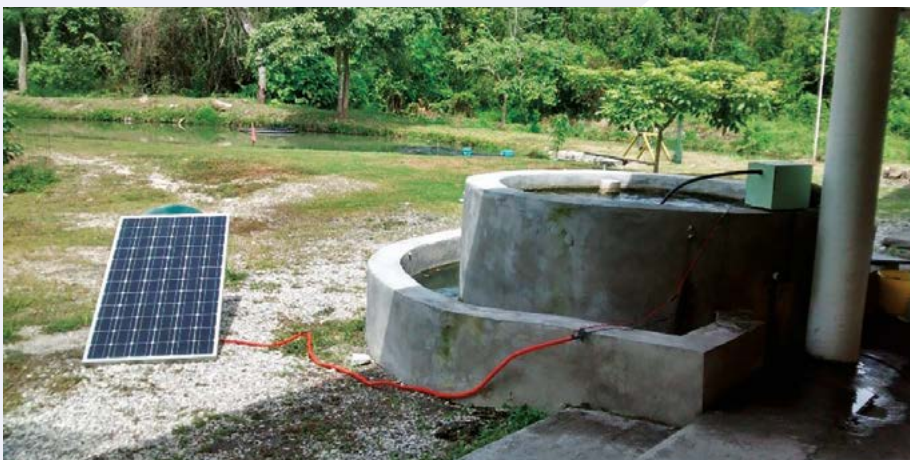
Figura 1. Estanque utilizado en el cultivo de tilapia var. Spring .

Se estableció en un estanque circular de cemento de 2.5 m de diámetro por 1 m de alto (Figura 1), 150 tilapias ( Oreochromis niloticus L.) var. Spring de 30 días de edad (Figura 4A). El estanque contó con una bomba de aireación (DHC80-12S Covron® N°610959 de 12 V Aquatic Eco-Systems, Inc. Since 1978 Diaphragm blower), para la oxigenación de las tilapias diariamente en periodos de entre 3 y 5 horas. La energía para el funcionamiento de esta bomba fue generada a través de un panel solar casero. También se dispuso de una toma de agua potable para realizar los recambios de agua en el estanque; el volumen de