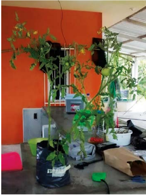
Figura 5. Planta de tomate cv. Saladette establecida en composta y regada con agua acuícola por 85 días.

obtuvo el mayor peso cuando se regó con agua acuícola, seguido del riego con la combinación de agua potable con agua acuícola en el riego (Figura 6).