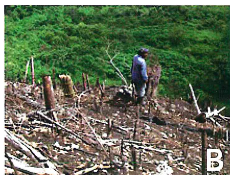
Figura 1. A: Paisaje típico de un sitio destinado a agricultura migratoria de ladera en áreas tropicales de México. B: Selección del sitio inmediato.