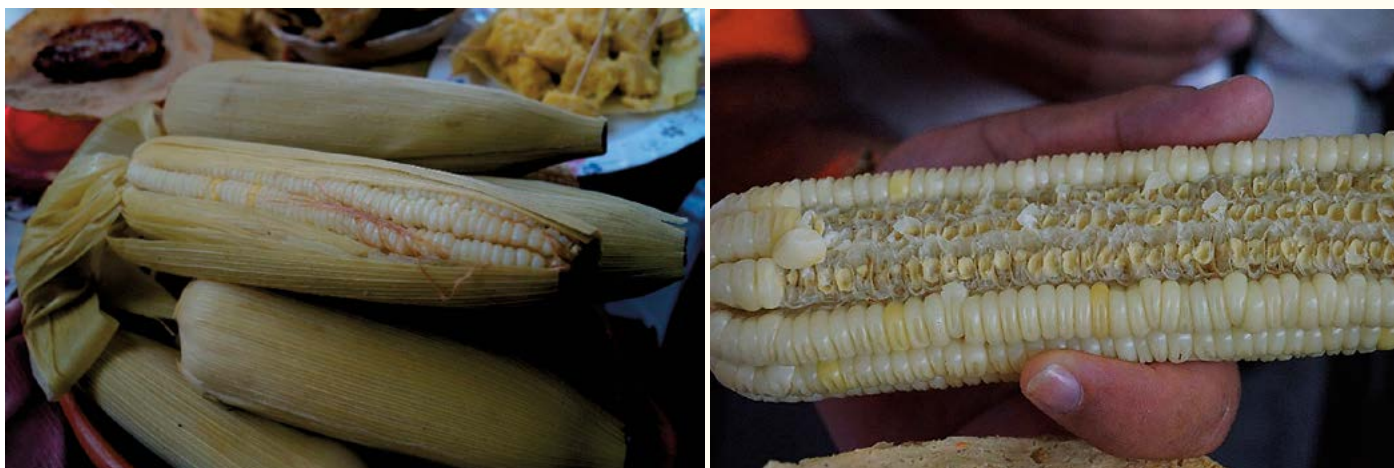
Figura 2. Elotes hervidos y degustados en la evaluación sensorial.