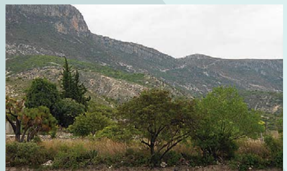
Figura 5. Vista del Cerro Viejo y ubicación de senderos para exploración de fósiles.