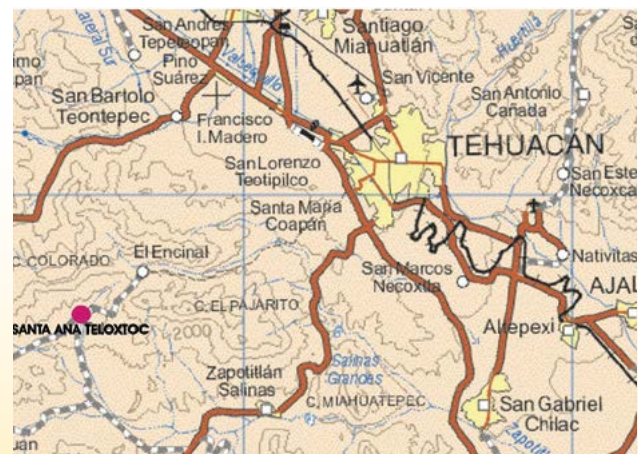
Figura 1. Localización de Santa Ana Teixtoct, Tehuacán; Puebla, México.

La investigación fue abordada de lo general a lo particular por aproximaciones sucesivas, iniciando con una síntesis