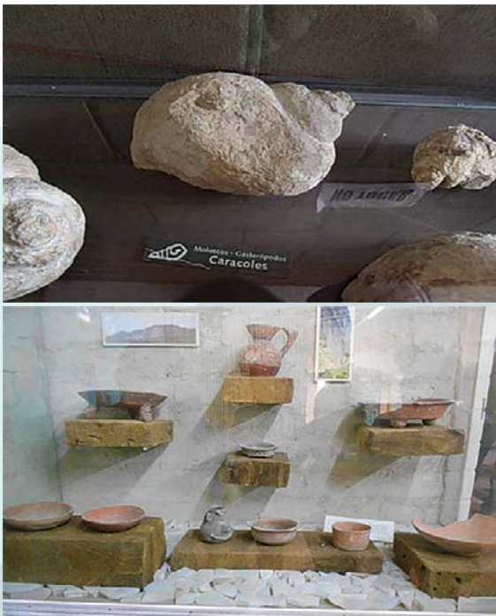
Figura 6. A: Muestra de fósiles marinos en el Museo Comunitario HICUPA . B: Cerámica de los primeros pobladores de Santa Ana Teloxtoc, Puebla. México.

Las principales limitantes para las actividades económicas son la baja precipitación pluvial y la dominancia de terrenos con pendiente que provoca erosión hídrica, así como el relativo aislamiento de la comunidad. Es necesario promover la conservación de la flora y fauna local como parte del paisaje, así como, de los valiosos recursos marinos fosilizados procedentes del periodo cretácico. El Museo Comunitario HICUPA , juega un papel primordial para resguardar el patrimonio y se sugiere sea considerado como un centro de estudios paleontológicos in situ. Las instituciones locales como las escuelas de educación, el Museo Comunitario y el ejido, pueden ser el punto de partida para construir una organización importante y desarrollar capacidades humanas que el turismo rural requiere. Se sugiere planificar el aprovechamiento de manantiales; elaborar estudios para aprovechar el agua subterránea; construir obras de conservación de suelo y cosechar o captar agua de lluvia; así como, brindar capacitación en agricultura orgánica y protegida con sistemas de riego ahorradores. Un factor