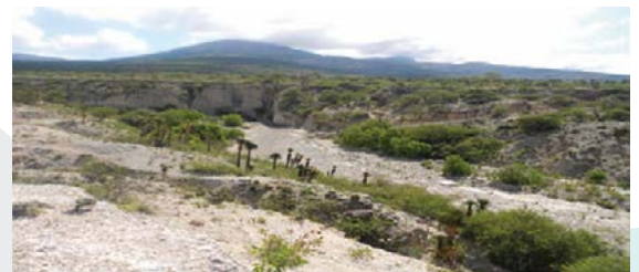
Figura 4. Panorama topográfico de Santa Ana Teloxtoc, Tehuacán; Puebla, México, que facilita escurrimientos superficiales