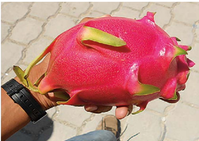
Figura 9. Fruto de pitahaya ( Hylocereus spp.), cuyo cultivo pudiera ser alternativa económica en la región de estudio.

importante es promover el ordenamiento territorial para definir las áreas productivas y de turismo; profesionalizar a las organizaciones de gestoría; capacitación, asesoría en servicios y administración del turismo rural; gestionar