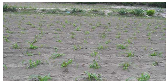
Figura 3. Parcela con maíz ( Zea mays ) asociado con frijol ( Phaseolus vulgaris ).