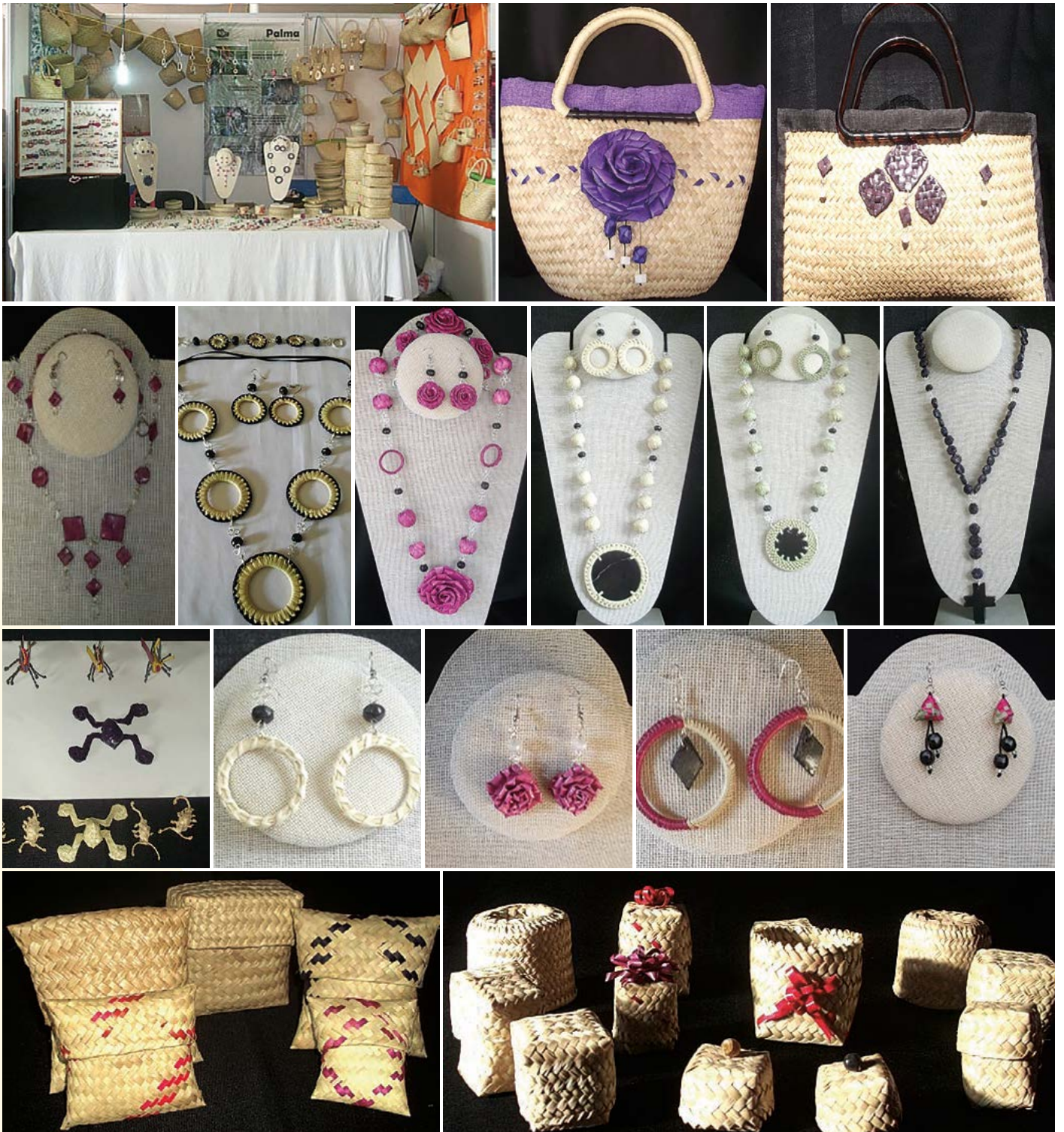
Figura 7. Muestra de artesanías elaboradas por el grupo IXMACUPA .