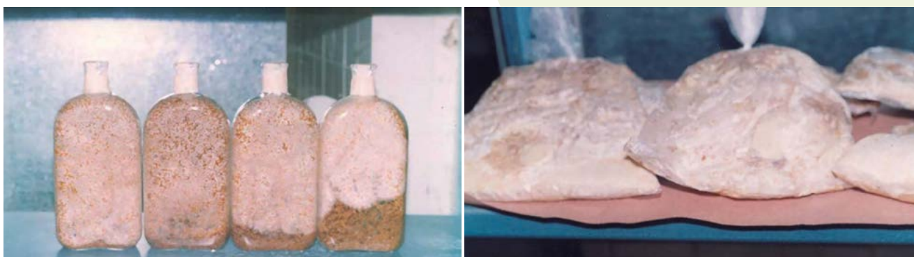
Figura 3. A: Matrices (Botellas Roux) con salvado de trigo inoculadas con el hongo ( V. hemileiae ). B: Bolsas de plástico de alta densidad lineal inoculadas con salvado de trigo con el hongo ( V. hemileiae ).

que el mayor nivel de infestación, cantidad de pústulas de roya por hoja y defoliación se observó en el tratamiento testigo, el cual se inoculó con H. vastatrix sin V. hemileiae (Figura 4).