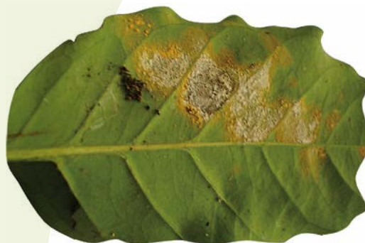
Figura 1. Hoja de cafeto ( Coffea arabica ) afectada por roya ( Hemileia vastatrix Berk et Br.) con pústulas color amarillo. El micelio color blanco corresponde a Verticillium hemileiae Bouriquet.

Un dato relevante en el proceso de aislamiento y multiplicación del hongo parasítico fue determinar el pH del medio de cultivo en el cual ( V. hemileiae ) generara mayor concentración de conidios, resultando que es necesario ajustar el pH de la solución del medio de cultivo a 5.5 porque es donde presentó mayor formación de conidios con 2.56 \times 10^5 , germinación de 91.80%