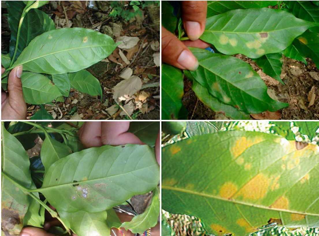
Figura 4. A: Hojas de cafeto con menor cantidad de pústulas de roya ( H. vastatrix ). B: Hojas de cafeto con tratamiento testigo, mostrando mayor con mayor cantidad de pústulas de roya. C: Presencia del hongo ( V. hemileiae ) después de su inoculación. D: Pústulas de ( H. vastatrix ) en el tratamiento testigo sin aplicación en condiciones de campo.