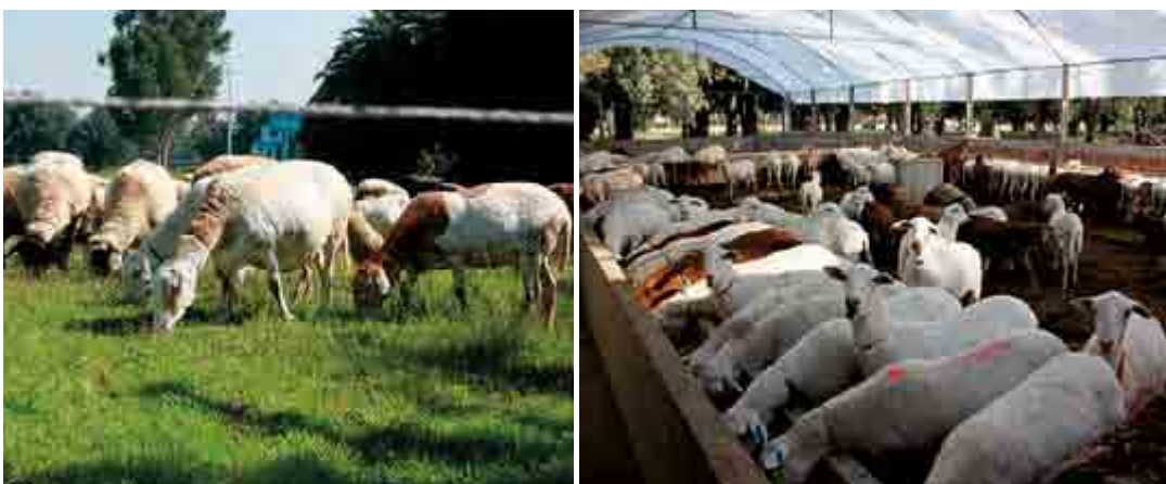
Figura 4. Periodos críticos (producción de gametos, tasa ovulatoria, mortalidad embrionaria, programación fetal, producción de calostro, entre otros) en el proceso productivo de las borregas, donde los problemas en la alimentación puede afectar el éxito productivo del ganado (Martin et al. , 2004).

Otro tema de gran interés para mejorar el ciclo productivo de los pequeños rumiantes es la selección genética basada en la rusticidad y resistencia a endo y ecto-parásitos. Se sabe que los pequeños rumiantes son huéspedes de muchas especies de endoparásitos. La incidencia es mayor en aquellos países que se encuentran entre los trópicos, por las elevadas temperaturas y humedad. Los parásitos gastrointestinales inducen trastornos que interfieren en el aprovechamiento de la alimentación y el desarrollo óptimo del individuo, lo que provoca pérdidas, anorexia, anemia, retraso en el crecimiento y en la presentación de la pubertad; asimismo, en general disminuye la eficiencia reproductiva, además de favorecer la susceptibilidad de enfermedades secundarias, lo que incide en pérdidas en la producción. La investigación de la selección