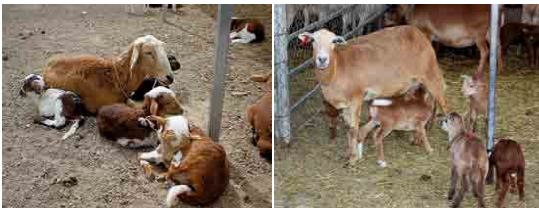
Figura 5. Habilidad materna en la oveja Pelibuey.

por temperamento, habilidad materna, producción de leche y rusticidad, mejorarían la productividad, además de darle mayor calidad y ética a las industrias.