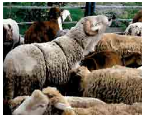
Figura 3. Interacción del "efecto macho" y restricción del amamantamiento en la disminución del anestro postparto.