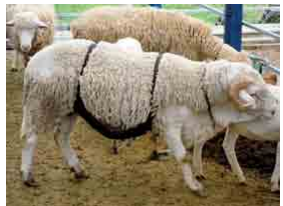
Figura 2. Representación de los efectos socio-sexuales en ovinos.