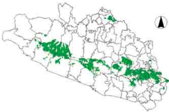
Figura 3. Mapa de potencial productivo para el cultivo del aguacate Hass en el estado de Guerrero.

El Cuadro 1 muestra que el Distrito de Desarrollo Rural (DDR) con mayor superficie de áreas potenciales para cultivar aguacate, es el de Tlapa, seguido de Chilpancingo y Altamirano; en este último no se tienen registradas áreas cultivadas. Considerando que actualmente se siembra el cultivo de maíz en áreas marginales en estos DDR, con rendimientos bajos, esta información puede usarse para programas de reconversión productiva con aguacate.