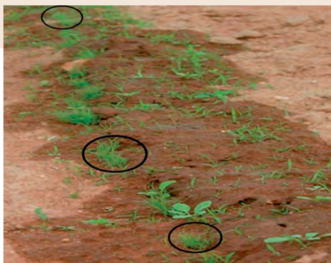
Figura 7. Siembra discontinua de cariósidos permite diferenciar la especie de interés