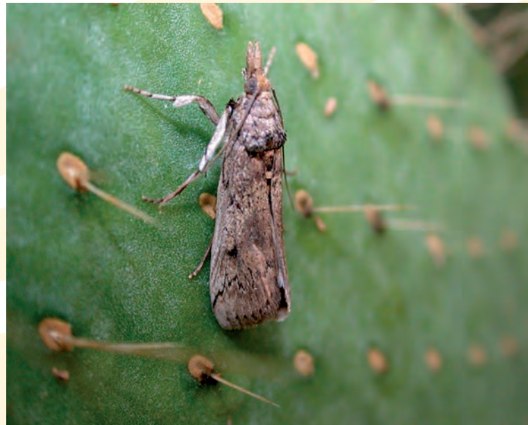
Figura 1. Hembra de la palomilla del nopal ( Cactoblastis cactorum ) con palpos maxilares que se proyectan hacia delante.

A la fecha la palomilla del nopal aún no se encuentra en México, aunque los estudios de Hight y Carpenter (2009) predicen su avance de 160 km por año (Figura 2).