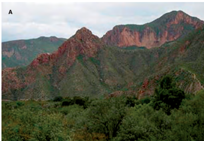
Figura. 5. Grandes superficies del territorio nacional se encuentran en condiciones de baja cobertura de suelo.

Se ha estudiado el efecto de dióxido de titanio (TiO 2 ) en forma de nano partículas y no nano sobre la germinación y crecimiento de plántulas de espinaca evaluados por Zheng et al. (2005), quienes reportaron incrementos de 0.25% a 4% en la germinación y vigor de semilla estimulada con la forma nano particulada (NP). Gracias a su densidad de semilla por kilogramo y a su rapidez para establecerse, las gramíneas representan un aliado para proteger al suelo de la erosión. En estudios realizados, las plántulas presentaron mayor peso seco, concentración de clorofila y tasa