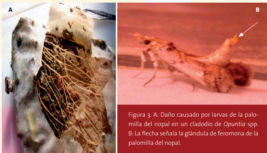
Figura 3. A: Daño causado por larvas de la palomilla del nopal en un cladodio de Opuntia spp. B: La flecha señala la glándula de feromona de la palomilla del nopal.

Al considerar el tamaño de los insectos, se puede deducir que las glándulas que producen estas sustancias son aún más pequeñas y, por lo tanto, la cantidad producida de feromona es aún menor. Así, lo que es una desventaja en la investigación inicial, ya que para aislar e identificar las sustancias se trabaja a partir