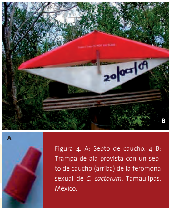
Figura 4. A: Septo de caucho. B: Trampa de ala provista con un septo de caucho (arriba) de la feromona sexual de C. cactorum , Tamaulipas, México.

de cantidades muy reducidas, se convierte en una ventaja cuando ya se tienen los compuestos identificados y sintetizados porque no se necesitan cantidades mayores a 10 gr para vigilar varios cientos de hectáreas. Por ejemplo, la hembra de la palomilla del nopal ( Cactoblastis cactorum ) libera “puffs” de 10-20 ng ( 10-20 \times 10^{-9} g) por hora, o bien, 0.000000010 g ha -1 (Heath et al. , 2006). A la fecha se utilizan varios dispositivos, como los microcapilares, fibrillas, encapsulados y microesferas, que cumplen su papel como liberadores de feromonas. Sin embargo, el potencial de nano-liberadores y nano cápsulas, principalmente de polímeros (Serban et al. , 2010) o de Quitosan, pueden competir favorablemente con las emisiones de insectos en campo y funcionar sólo a la hora prevista (de 5:00 am a 6:00 am) y dar un gran impulso al manejo de insectos mediante feromonas.