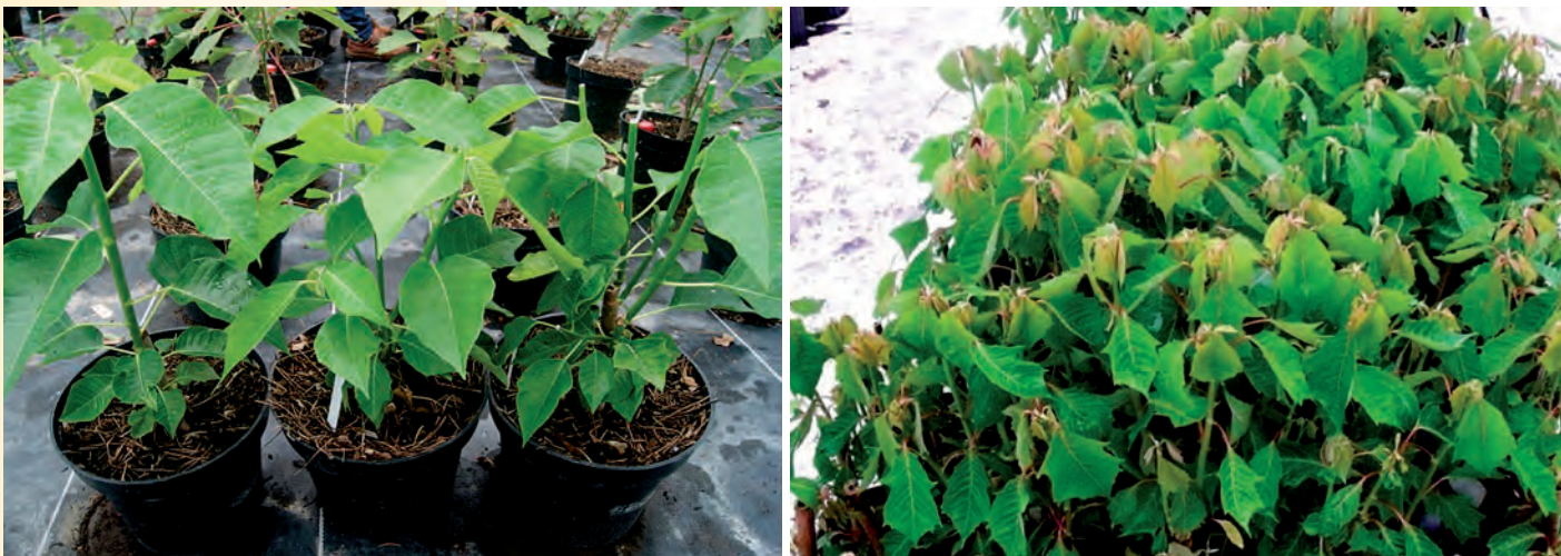
Figura 5. Plantas comerciales de nochebuena ( Euphorbia pulcherrima Willd. ex. Klotzsch) obtenidas a través de enraizamiento de estacas.