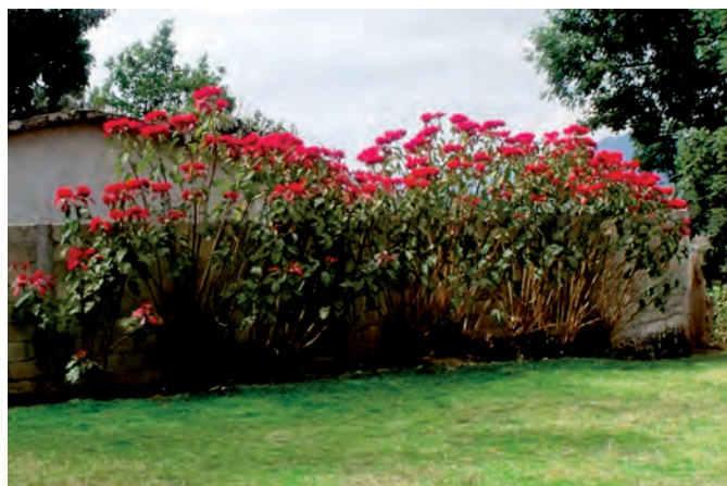
Figura 1. Nochebuena de sol ( Euphorbia pulcherrima Willd. ex Klotzsch) en traspatio, ideal para la obtención de varetas.

Si las varetas no se van a enraizar el mismo día, o bien, la acción de enraizamiento se va a hacer en un lugar distante