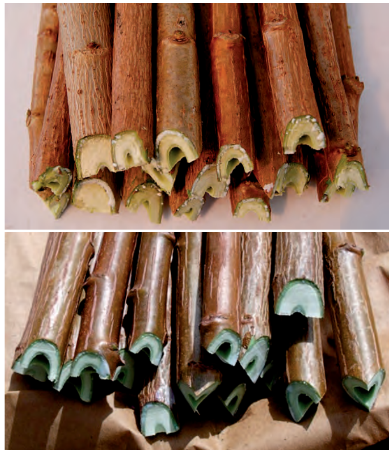
Figura 3. A: Varetas sin hoja recién separadas de la planta madre de Euphorbia pulcherrima Willd. ExKlotzsch, con la exudación de látex característico. B: varetas listas para enraizar o para traslado.

Se puede utilizar bolsa negra de plástico de cuatro litros de capacidad, maceta negra soplada de 3,5