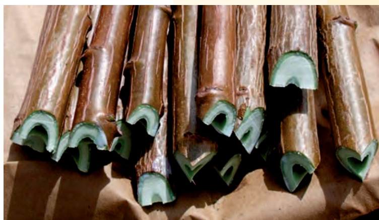
Figura 4. Varetas de nochebuena ( Euphorbia pulcherrima Willd. ex Klotzsch) con el doble corte en bisel, ideal para enraizarlas.

Si las condiciones de enraizamiento son a “cielo abierto” y se presentan precipitaciones pluviales atípicas que puedan favorecer el incremento de la humedad relativa, amén de que se registre una temperatura ambiental superior a 30 °C, es posible que se manifieste alguna enfermedad fungosa, para lo cual se sugiere aplicar algún fungicida de manera preventiva, como el caldo bordelés a base de la combinación de sulfato cúprico y cal hidratada, o bien, Manzate® a base de Mancozeb (ion zinc y etilen bis ditiocarbamato de manganeso, equivalente a 800 g de Ingrediente activo por kilogramo), en dosis de 1 g.L -1 de agua. Cuando la hoja de encino u ocochal cernido en mezcla con atocle se utiliza como sustrato, se debe de prever la aparición de maleza y si llega a presentarse, debe