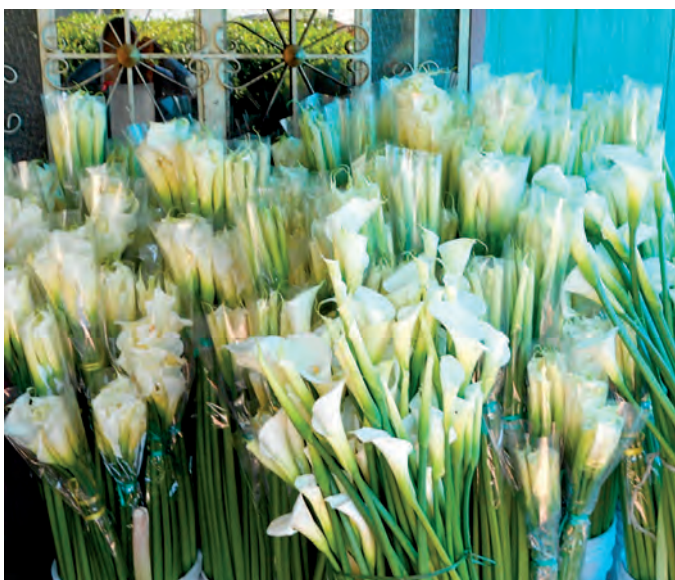
Figura 6. El empaque utilizado para la venta de alcatraz es bolsa de celofán, hojas del mismo alcatraz e hilo rafia.