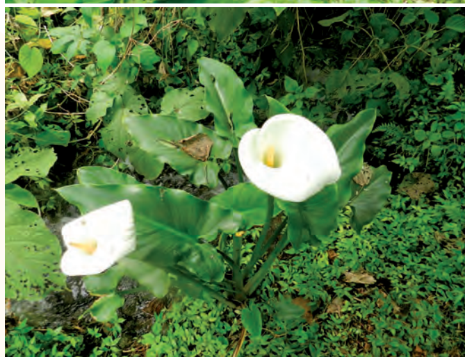
Figura 4. Cultivo de alcatraz ( Zantedeschia aethiopica (L) K. Spreng) en La Perla, Veracruz, México.