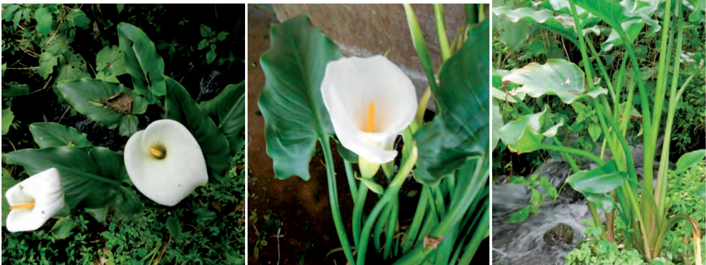
Figura 1. Plantas de alcatraz ( Zantedeschia aethiopica (L) K. Spreng) en condiciones ruderales cercanas a fuentes permanentes de agua.

El origen del alcatraz se encuentra en las zonas templadas frías ubicadas en el sur y este de África (Wright y Burge, 2000). Esta planta es apreciada por sus inflorescencias, que consisten de numerosas flores adjuntas a lo largo de una espádice envuelta por una espata (Funnell, 1993). Generalmente, su producción se realiza en forma protegida y a campo abierto, como ocurre en áreas con clima templado. En México se cultiva principalmente el alcatraz blanco ( Zantedeschia aethiopica (L) K. Spreng) o ‘Criollo’ en ámbitos templado-húmedos y la experiencia agronómica con otros cultivos es limitada (Etcheverría, 2002; Paredes, 2006) (Figura 1).