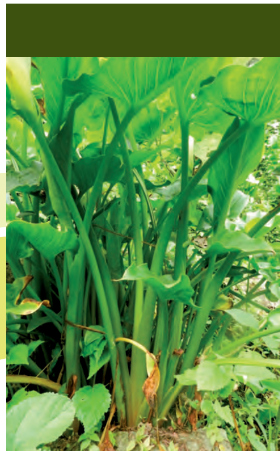
Figura 2. A: Hojas y pecíolos de alcatraz ( Zantedeschia aethiopica (L) K. Spreng). B: Flor de corte.

Como instrumento se utilizó una encuesta para recopilar la información, con preguntas enfocadas directamente a los productores de alcatraz con la ayuda de la Oficina de Fomento Agropecuario del mismo municipio para seleccionar las localidades. El ta-