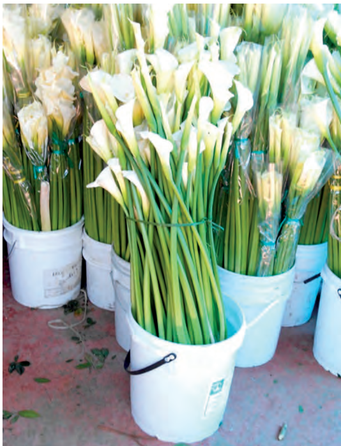
Figura 5. Flores de alcatraz ( Zantedeschia aethiopica (L) K. Spreng) que cumplen con la longitud de mercado para la central de abastos de la Ciudad de México.