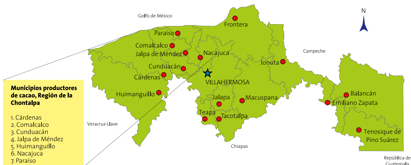
Figura 4. Ubicación geográfica de la región de la Chontalpa en Tabasco, México.

región que acopian, secan y fermentan la almendra; de éstos, la Unión Nacional de Productores de Cacao (UNPC), que aglutina a la mayoría de ejidatarios, opera sólo 33%.