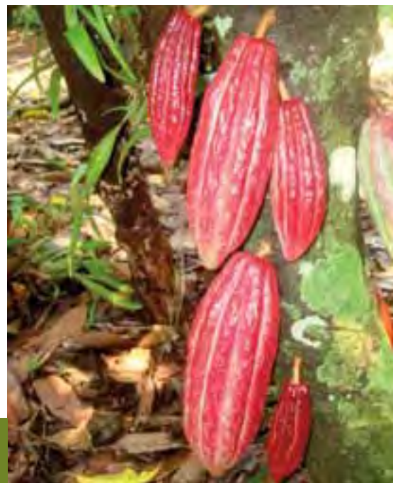
Figura 1. Diferentes tipos de cacao ( Theobroma cacao L.) en huertas tradicionales de la región de la Chontalpa, Tabasco, México (Fotos Cadena-Iñiguez, J. 2010).