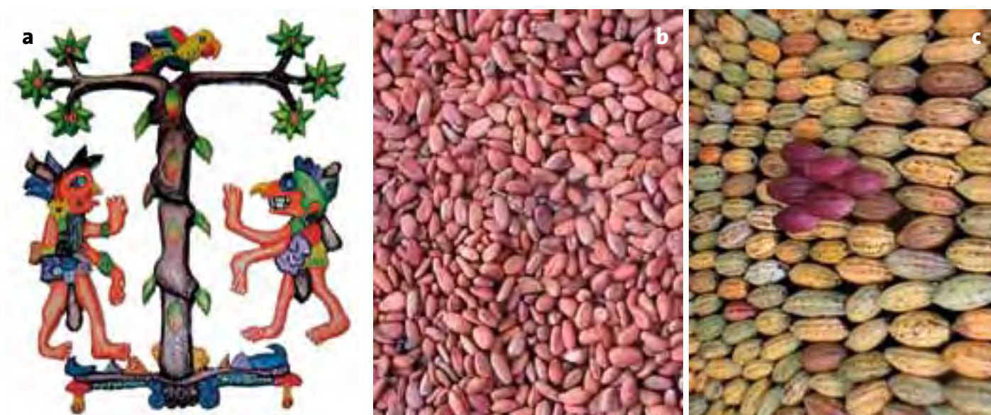
Figura 6. a: Representación del árbol de la vida que los mayas atribuían al cacao; b: almendra de cacao seco; c: Frutos de cacao recién cosechados.

En el Estado se cultivan alrededor de 40,000 hectáreas manejadas por más de 30 mil familias, cuyos rendimientos unitarios no superan los 480 kilogramos por hectárea