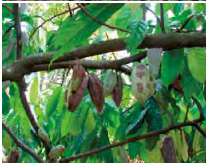
Figura 5. Plantación de cacao ( Theobroma cacao L.) representativa de la región de la Chontalpa, Tabasco, México, con edad avanzada y presencia de enfermedades.