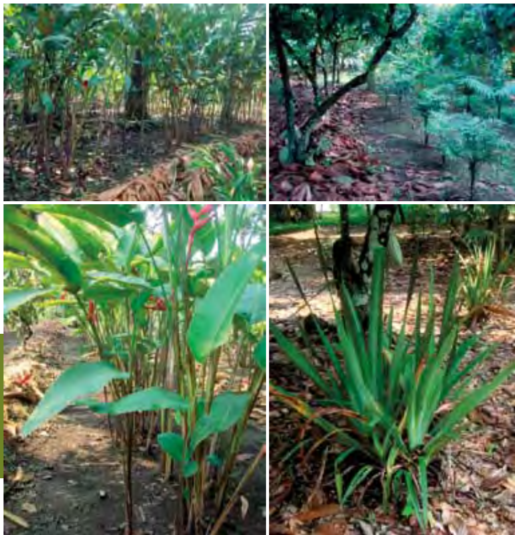
Figura 7. Sistemas mixtos de cacao con follajes y especies ornamentales tropicales, como estrategia para incrementar la rentabilidad de plantaciones de cacao en la región de la Chontalpa, Tabasco, México.