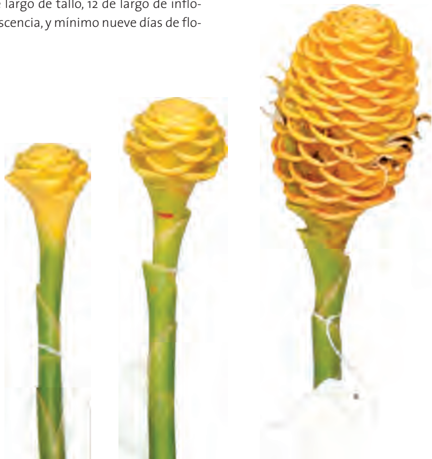
Figura 7. Puntos de corte Maraquitas y Maraca.