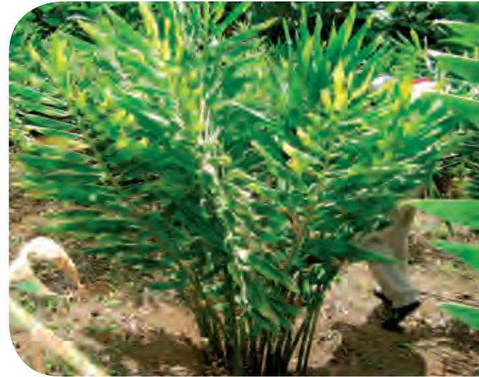
Figura 2. Planta adulta de maraca amarilla ( Zingiber spectabilis cv. 'Golden') y tres diferentes estados de corte comercial (maraquitas y maracas).

zerumbet (L.) Smith desarrolla un tallo floral de color verde cuando inmaduro, y rojo cuando ha madurado; las