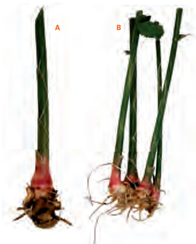
Figura 4. A: Propagación de maraca por rizoma y B: por división de pseudobulbos.

La raíz de la maraca no sobrepasa los 30 cm de profundidad, por lo que puede prosperar en suelos poco profundos, de textura franca a arcillosa con buena retención de humedad y buen drenaje, para evitar pudrición. Es recomendable usar una cubierta vegetal de rastrojo de caña de azúcar ( Saccharum officinarum ), hojas de plátano ( Musa spp. ), ramas delgadas, pulpa del grano de café ( Coffea arabica ), paja de leguminosas, o bien, se puede usar acolchado plástico para atenuar la emergencia de especies de malezas (Figura 5), con el fin de reducir la mano de obra empleada, mantener humedad, y acelera la brotación y floración.