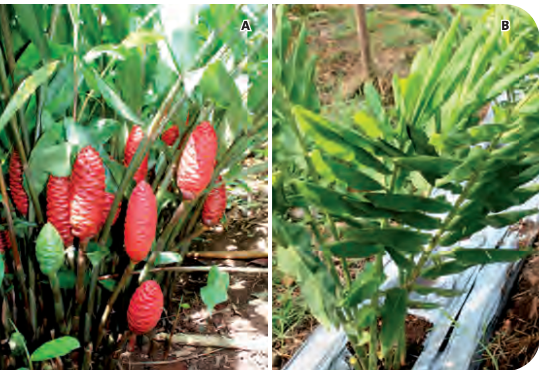
Figura 5. Producción de maraca verde y roja ( Zingiber zerumbet cv. 'Green Shampoo') con A: cobertera vegetal, B: acolchado plástico.