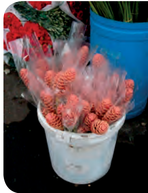
Figura 8. Comercialización en la central de abasto del Distrito Federal.

El mercado mexicano de maracas es incipiente, por lo que la calidad y la presentación de los tallos florales debe cuidarse para conquistar mercado y mantenerse. Debido a que las maracas tienen una vida de florero mayor a 12 días, su inclusión en bouquets agrega valor. El punto de corte temprano, llamado Maraquitas, ofrece otra opción más en presentación comercial sin afectar la vida de florero. La maraca es una planta ornamental tropical que, al combinar diferentes cultivares, puede tener producción y flujo de efectivo todo el año, por lo que es una buena opción para invertir en la floricultura tropical.