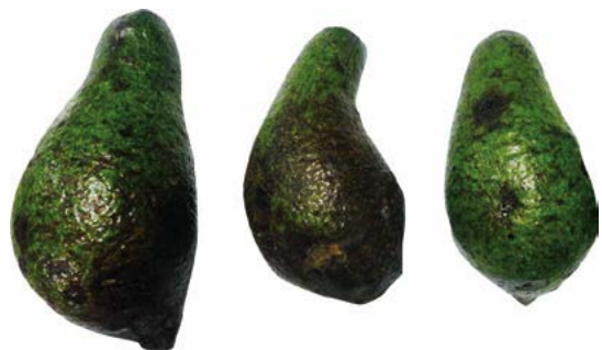
Figura 2. Frutos de chinene ( Persea schiedeana Ness) colectados en los municipios de Huatusco, Coscomatepec, Ixhuatlán del Café y Chocamán, Veracruz, México.

El alto contenido de grasa en el chinene (28.1 % en la selección IXPE, casi el doble de lo reportado para el aguacate Hass), lo hace susceptible de ser utilizado como fuente de aceites para la elaboración de productos cosméticos, entre otros usos (Serpa et al. , 2014; Cruz-Castillo et al. , 2017; López-Yerena et al. , 2018). En general, se observa una correlación negativa entre los contenidos de grasa y de humedad. Por otro lado, hay una correlación positiva entre el contenido de grasa y el aporte calórico. El aporte calórico de la pulpa de las selecciones PETR y TLAL fue el más bajo y presentó diferencia significativa con el resto de las selecciones.