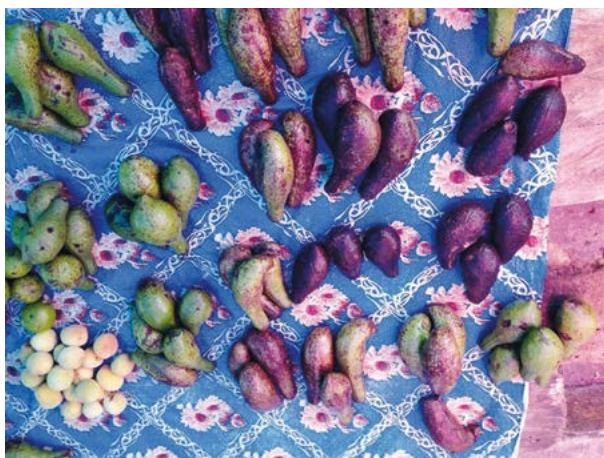
Figura 1. Variedad fenotípica de chinenes ( Persea schiedeana Ness) en el mercado de Chocamán, Veracruz, México.

Los frutos maduros se conservaron a -20\text{ }^{\circ}\text{C} , para realizar posteriormente los análisis físico-químicos de su pulpa. Los análisis se llevaron a cabo en el Centro de