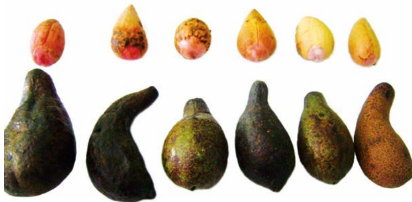
Figura 3. Semillas y frutos maduros de chinene ( Persea schiedeana Ness) colectados en los municipios de Huatusco, Coscomatepec, Ixhuatlán del Café y Chocamán, Veracruz, México.

Las selecciones PETR y TLAL, ubicadas a 1757 y 1492 msnm respectivamente; tuvieron el mayor contenido de humedad en su pulpa (alrededor de 74 %), que presentó diferencias significativas ( P \leq 0.05 ) con el resto de las selecciones, lo que de acuerdo con Zapata et al. (2016), puede reducir la vida de anaquel de frutos de Persea , que de acuerdo a Del Angel-Colonel et al. , (2010), es de por sí baja. Los contenidos de grasa de estas selecciones fueron los más bajos (11 %), presentando diferencia significativa con el resto de las selecciones; las cuales tuvieron valores superiores a lo reportado en grasa para el aguacate variedad Hass (15.4 %).