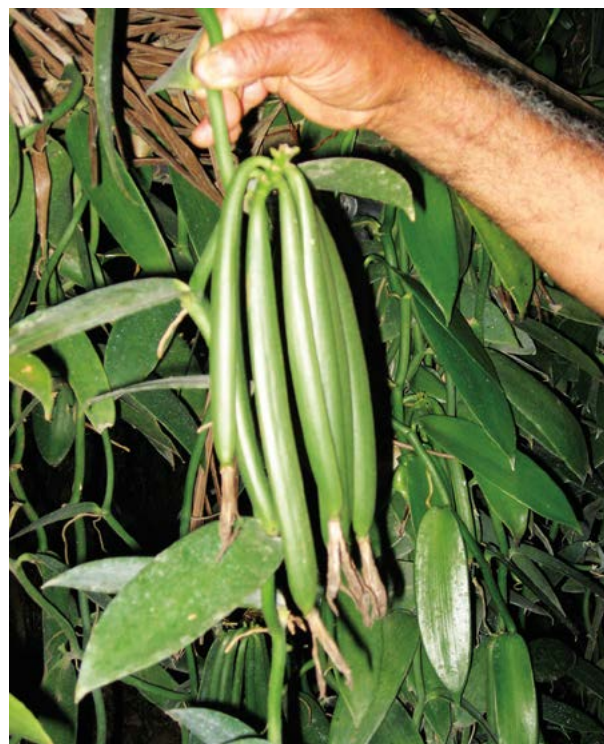
Figura 3. Frutos de vainilla ( Vanilla planifolia Jacks. ex Andrews) en la región Totonacapan, México.