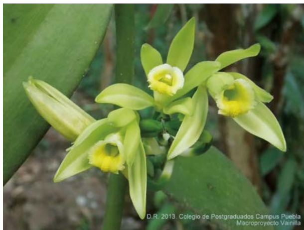
Figura 2. Flores de vainilla ( Vanilla planifolia Jacks. ex Andrews) en la región Totonacapan, México.

De esta manera se identificaron tres perfiles de rendimiento asociados con el genotipo y la ubicación geográfica del genotipo Q6. Convencionalmente, el mejor rendimiento está definido por altos valores en los órganos de cosecha (Maturano, 2002; Andrade, 1996). De acuerdo a dicho argumento el genotipo Q6 representado en los perfiles de rendimiento PR2 y PR3 de la Figura 1, podría considerarse como una referencia para seleccionar indicadores de rendimiento en