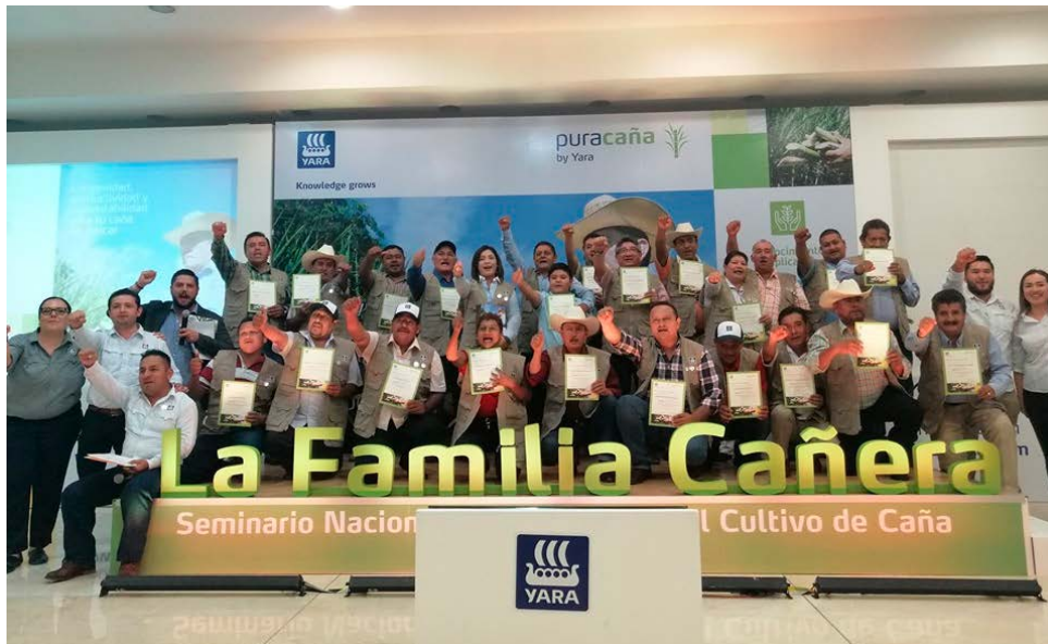
Figura 4. La Familia Cañera by Yara México, sede Veracruz 2019.

El programa de La Familia Cañera by Yara México, concluyó con una graduación donde a los productores que completaron todo el programa de capacitación se les otorgó un chaleco (distintivo), con las insignias que se habían ganado en cada capacitación y un diploma de participación (Figura 4). El graduarse tiene relevancia para los productores debido a que se les reconoce su constancia y participación, lo que se vuelve un factor que motiva a que éste implemente las prácticas en su parcela.