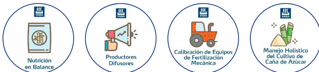
Figura 3. Insignias de la familia cañera dentro del modelo de capacitación y formación para la difusión de innovaciones en el sector cañero.

En 2019, la empresa Yara México a través de sus expertos en caña de azúcar se acercaron al Colegio de Posgraduados Campus Córdoba para solicitar apoyo en una serie de programas de capacitación a cañeros que abastecen a dos ingenios de la zona centro del estado de Veracruz y a otro en Othon P. Blanco, Quintana Roo. El modelo de productor difusor/productora difusora les pareció una iniciativa que se alineaba con su interés en pro del desarrollo del campo cañero. Derivado de esto, la empresa creó el programa: La Familia Cañera by Yara México. La elección de productores que participarían en la capacitación se hizo por parte del personal de campo del ingenio utilizando las premisas de: fuertes redes sociales informales de los productores, inclusión basada en la equidad de género y reputación. Este programa, tuvo una serie de temas de capacitación: motivación al cambio, productores difusores, manejo holístico de la caña de azúcar y nutrición de cultivos. Al atender dichas capacitaciones, los productores recibían una insignia que avalaba su participación en la capacitación (Figura 3).