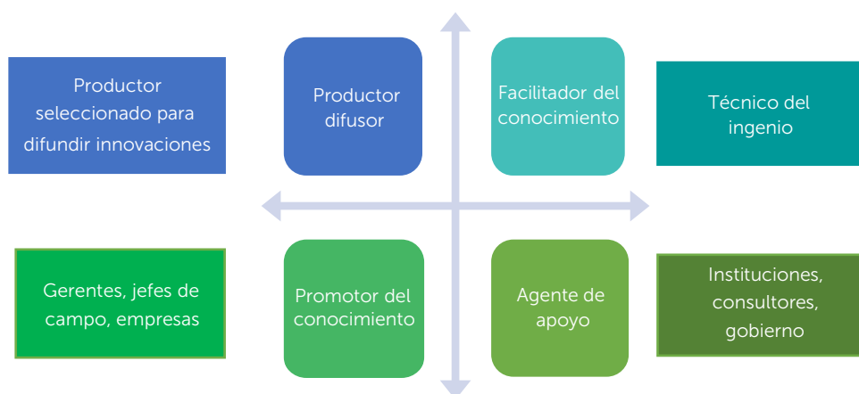
Figura 1. Componentes del sistema de innovación en la producción de caña de azúcar con base en principios de educación para adultos.

Se hizo una propuesta metodológica denominada productor difusor/productora difusora, mismo que se basa en elegir productores para convertirse en actores que transfieran tecnología y formen a sus pares. Se espera que estos productores y productoras operen dentro del marco de un sistema de innovación, con el apoyo de diversos actores que soporten los procesos de difusión (Figura 1). La capacitación se enfoca no únicamente en componentes técnicos como tradicionalmente se concibe para el sector agropecuario, sino que se deben considerar aspectos de desarrollo humano y educación de adultos, utilizando técnicas bajo los principios de la andragogía y la psicología. Con elementos de la educación constructivista que aborden principios cognitivos o de desarrollo