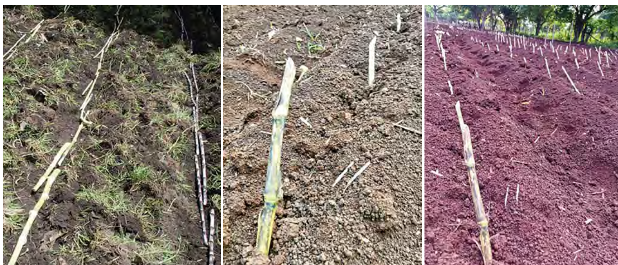
Figura 2. De izquierda a derecha: siembra cruzada (T1); siembra estaqueada (T2) de pasto maralfalfa ( Pennisetum sp.).

bra como primer factor, la fertilización nitrogenada (urea 46%) como segundo factor, y cuatro repeticiones por tratamiento. Los niveles del primer factor estuvieron constituidos por el método de siembra: tallos enteros o siembra cruzada y trozos de tallos o siembra estaquea; los niveles del segundo factor fueron tres cantidades de urea: 100, 150 y 200 \text{ kg ha}^{-1} . En total se tuvieron seis tratamientos. Las variables de estudio consideradas fueron: número de brotes, largo y ancho de las hojas; rendimiento a los 60 y 90 días después de la siembra (dds). El número de rebrotes se midió a partir de la primera semana después de haber sembrado; tres veces por semana se contaron todos los rebrotes que había por parcela durante seis semanas. El largo y ancho de las hojas se realizó con la ayuda de un flexómetro, tomándose tres hojas por planta señalada desde la vaina hasta el ápice. Se seleccionó una hoja basal, media y terminal. Se