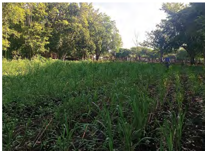
Figura 1. Pasto maralfalfa ( Pennisetum sp.) a 28 días después de siembra.

El diseño experimental utilizado fue en bloques al azar con arreglo factorial 2 \times 3 , utilizando el método de siem-