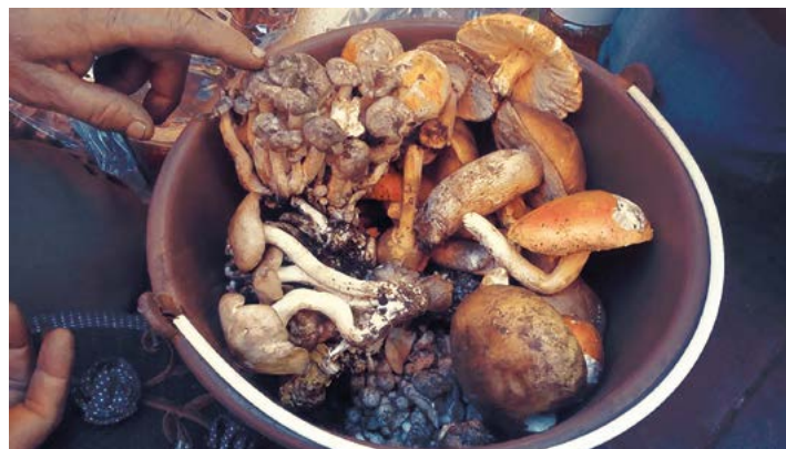
Figura 3. Hongos para venta en el mercado de Texcatitlan.

decir no lo comercializa. Existen dos formas de comercializarlos, la primera consiste en la venta a intermediarios en la misma localidad, en la cual el producto se paga a mitad de precio de lo que se encuentra en mercado, mientras que la segunda es la venta directa al consumidor en mercados locales, los principales lugares de comercialización son Texcatitlán, Zinacantepec, Toluca y Palmillas (Figura 3).