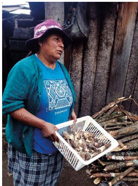
Figura 2. Pastora de la localidad de Agua Blanca.

La recolección de hongos constituye un ingreso para el sustento familiar, donde el 90% de los recolectores utilizan este recurso para venta y consumo propio, el 10% lo consume y/o lo regala a sus familiares cercanos, es