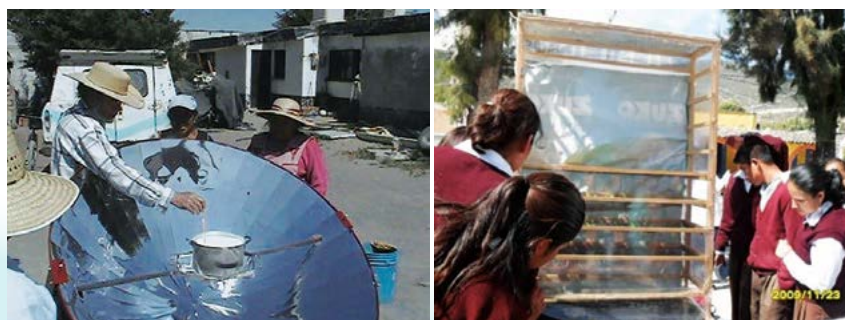
Figura 4. Utilización de hornos solares para la preparación de alimentos y deshidratadora de frutas y hortalizas.

contribuyan a reducir la pobreza rural, deben ser complementados con políticas públicas sólidas, inversiones y otros servicios. La capacitación con enfoque hacia la inclusión y el desarrollo, pone el