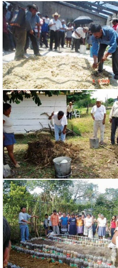
Figura 2. Elaboración de compostas y reciclado de envases como barrera para detener el suelo para la producción de hortalizas.

siembra de hortalizas (Figura 2). En este rubro se atendieron 15 municipios de los 24 participantes y en total 22 localidades (Cuadro 2). Destacó la asistencia técnica, beneficiando a 132 productores, seguido de los talleres con 68 beneficiarios.