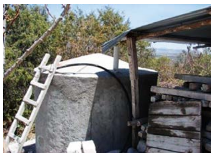
Figura 3. Cisternas de ferrocemento para la captación de agua de lluvia.

blema, se planteó la capacitación para la construcción de 25 estufas ahorradoras de leña en sus diferentes modalidades (Lorena, Lodo, Patsari, entre otras), además, se promovió la utilización de 10 hornos solares y construyeron 20 deshidratadores solares de alimentos (Figura 4).