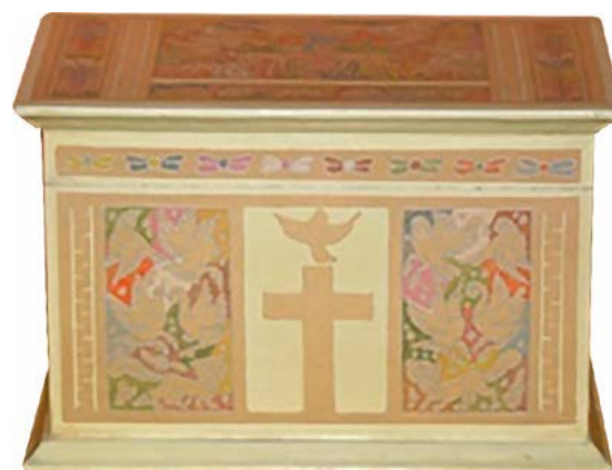
Figura 4. Urna cineraria con motivos religiosos

Si el precio de venta por unidad producida es de $1,000.00 MX y el costo variable unitario es de $500.00 MX, quiere decir que cada unidad que se venda, contribuirá con $500.00 MX para cubrir los costos fijos y las utilidades operacionales del taller. Respecto al punto de equilibrio de Carmín Artesanos, con un valor de venta por urna de $1,000.00 MX, se obtuvo que a partir de 323 unidades en el año se comienzan a generar utilidades. Se eligió hacer la evaluación con una tasa de interés aproximada de 12% que cobra la FND y 4% que es lo máximo que paga una institución financiera, en una proyección a 20 años, por lo que considerando en un primer escenario el uso de recursos propios y en el segundo utilizando financiamiento, mostró un valor actual neto (VAN) de $862,012.00 MX en el primero año, mientras que para el segundo año, un VAN de $772,362.00 MX; y tasa interna de retorno (TIR) sin financiamiento de 16% y con financiamiento de 18.6%. La resultante de costo beneficio (B/C), fue de 1.19 antes financiamiento y 1.1 después de éste, durante la vida útil de proyecto, con tasa de actualización de 4%. De acuerdo a los cálculos realizados la mejor opción fue operar