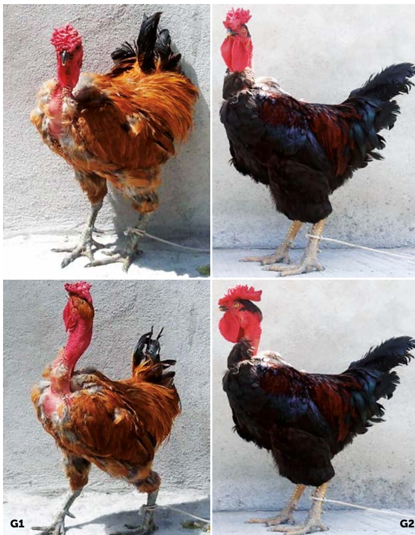
Figura 2. Gallos criollos con cuello desnudo y cresta rosa (CD y CR). G1: gallo utilizado en el grupo 1, peso vivo 2.600 kg. G2: gallo del grupo 2, peso vivo 2.965 kg. Estas aves fueron recolectadas de la avicultura de traspatio en Valle del Mezquital Hidalgo, México.

El porcentaje de pollos nacidos con CD y CN fue similar ( P>0.05 ). Los porcentajes fueron 53% pollos con CD y 47% pollos con CN (39 vs 35 pollos, Figura 3). Los resultados de esta investigación confirman que el gen Na presenta dominancia incompleta. Scott y Crawford (1977) observaron que el gen Na presenta dominancia incompleta y que los heterocigotos (Nana) tienen un pe-