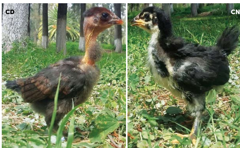
Figura 3. Pollos de 21 días de edad, CD: Pollo criollo con cuello desnudo (Nana), CN: Pollo criollo con cuello normal (nana).