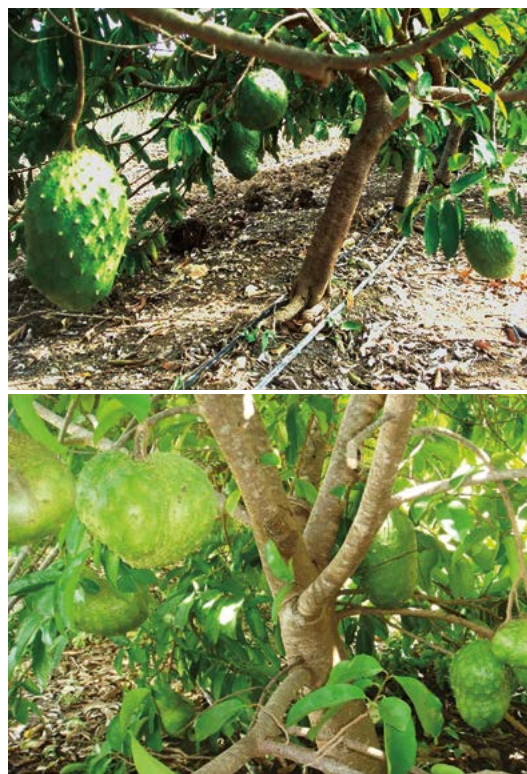
Figura 5. Árboles de guanábana en alta densidad con ocho años de edad Clon 12 (arriba); árboles de guanábana en alta densidad con nueve años de edad Clon 10 en producción (abajo).

paración de las espinitas del fruto (tricomas) se amplían, esto indica que el fruto tiene madurez fisiológica y está listo para cortarse. La metodología para la siembra y manejo de guanábana en altas densidades de producción, se encuentra disponible en el Colegio de Postgraduados Campus Campeche, Carretera Federal Haltunchen-Edzná, km 17.5, Sihochac, Champotón, Campeche.