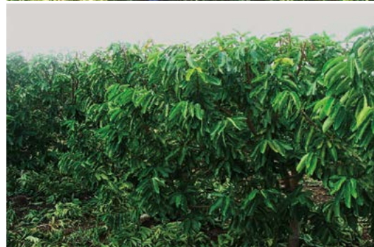
Figura 2. Árboles de guanábana en alta densidad después de ocho años de plantación (arriba); árboles de guanábana en alta densidad después de nueve años de plantación (abajo).