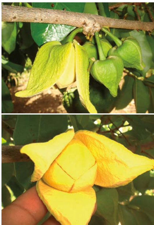
Figura 4. Floración de guanábana en alta densidad después de 90 días de la poda (arriba); flor lista para ser polinizada (abajo) en una plantación de ocho años de edad.